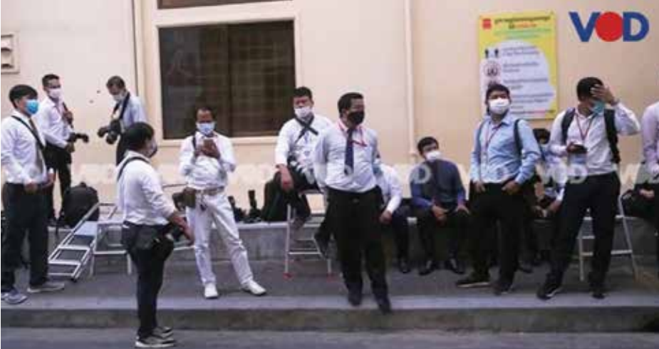
ក្រុមអ្នកសារព័ត៌មានកម្ពុជាឈរជុំគ្នា

អ្នកនាំពាក្យក្រសួងព័ត៌មាន លោក ទេព អស្មារិទ្ធ ក៏មិនបានឆ្លើយតបនឹង VOD ដោយហៅទូរស័ព្ទចូលជាច្រើន ដងមិនមានអ្នកទទួលយ៉ាងណាក្តីនាយក រដ្ឋមន្ត្រីកម្ពុជាលោក ហ៊ុន ម៉ាណែត ធ្លាប់ និយាយកាលពីចុងខែមករា ឆ្នាំ២០២៤