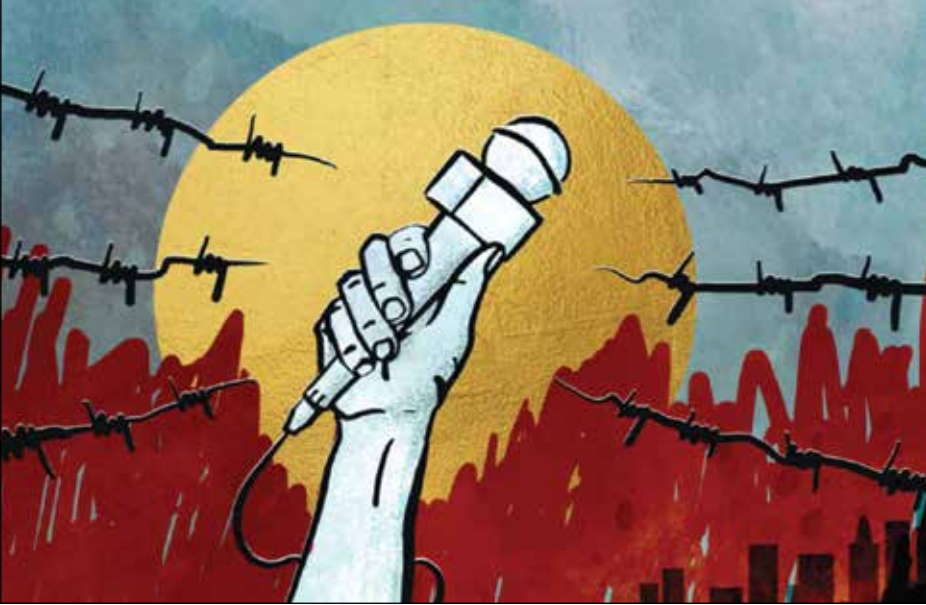
Voice of America Recognizes 30 Years of World Press Freedom Day

sions, but all failed at the end of the mission, except for the sector of “freedom of the press is the only way to succeed.” After five years, the Cambodian media continues to live in fear and extreme caution, because no protection movement continues to support them, only repression if you harm the interests or honor of the ruling party.