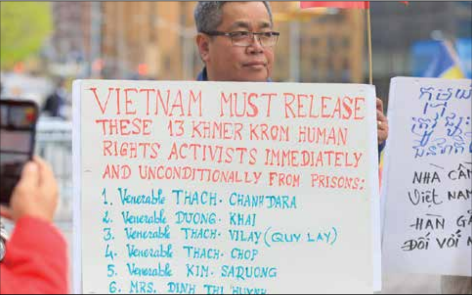
A group of 100 Khmer Krom staged protest outside of UN in New York on Friday, April 19, 2024 to demand the release of 13 Khmer Krom rights defend- ers who are in prison in Vietnam

ឱត្តប័ណ្ណនៃសេចក្តីប្រកាសជាសកល របស់អង្គការសហប្រជាជាតិស្តីពី សិទ្ធិមនុស្ស និង UNDRIP។ ជាពិសេស លោកស្រី Dinh Thi Huynh ត្រូវបាន លោក គៀន សុំធិ គូសបញ្ជាក់ថាជាស្ត្រី ខ្មែរក្រោមម្នាក់ដែលត្រូវបានចាប់ខ្លួន និងកាត់ទោសឱ្យជាប់ពន្ធនាគាររយៈពេល ពីឆ្នាំ២០១២ ព្រឹត្តិការណ៍ទំហំនាអន្តរជាតិ។