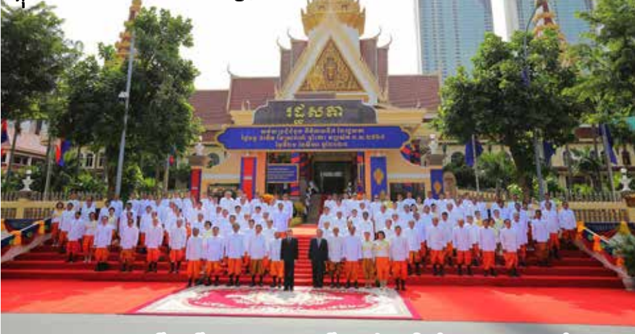
ព្រះមហាក្សត្រនរោត្តម សីហមុនី លោកនាយករដ្ឋមន្ត្រី ហ៊ុន សែន និងតំណាងរាស្ត្រ ចតុបជុំគ្នានៅក្នុង សម័យប្រជុំដំបូងនៃរដ្ឋសភានីតិកាលទី ៧

(KWP) ទទួលបាន ៣ អាសនៈ។ អាសនៈ ព្រឹទ្ធសភាចំនួន ២ ទៀត តែងតាំងដោយ ព្រះមហាក្សត្រ នរោត្តម សីហមុនី បាន ទៅគណបក្សប្រជាជនកម្ពុជា ហើយ អាសនៈចុងក្រោយចំនួន ២ អាសនៈ ដែលត្រូវបានតែងតាំងដោយរដ្ឋសភា ដែលគ្រប់គ្រងដោយគណបក្សប្រជាជន កម្ពុជាក៏បានទៅសមាជិកគណបក្សប្រជាជន