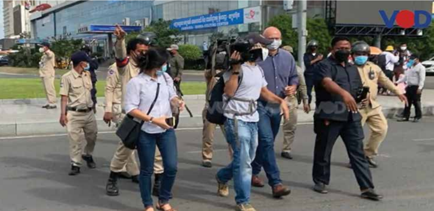
ក្រុមអ្នកសារព័ត៌មានត្រូវបានប៉ូលីសដេញចេញ

ស្ថិរភាពហើយដូចខ្លួនខ្ញុំផ្ទាល់ជាមន្ត្រី សាធារណៈដែលត្រូវទទួលខុសត្រូវ យើងអាចរៀនពីកំហុសរបស់យើង តាម ការលើកឡើងមួយចំនួនបានឲ្យដឹងថា ស្ថាប័នសារព័ត៌មានឯករាជ្យនៅក្នុង ប្រទេសកម្ពុជាកាន់តែតិចទៅៗ ក្នុង សភាពបែបនេះថាតើវាមានផលប៉ះពាល់ យ៉ាងដូចម្តេចសម្រាប់ប្រទេសប្រកាន់ លទ្ធិប្រជាធិបតេយ្យដូចជាកម្ពុជានោះ អាចដោះស្រាយ រហូតមានប្រព័ន្ធ ផ្សព្វផ្សាយឯករាជ្យមួយចំនួននៅក្នុង ប្រទេសកម្ពុជា យើងសង្ឃឹមថាពួកគេ អាចរីកចម្រើនក្នុងអំឡុងពេលរបស់ខ្ញុំ