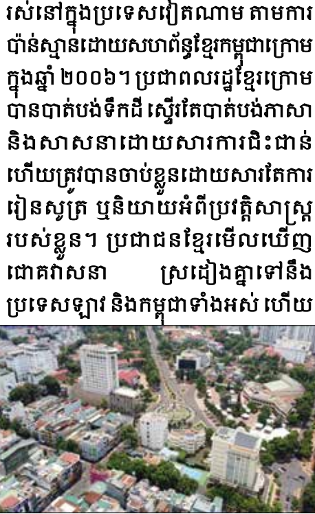
Boun Ma Thout Dak Lak, Vietnam

កម្ពុជាក្រោម។ នៅថ្ងៃអនាគត វៀតណាម អាចបញ្ចូលខេត្តទាំងនេះ និងធ្វើជាទឹកដីរបស់វៀតណាម ព្រោះក្រោមការអភិវឌ្ឍនេះ ជនជាតិវៀតណាមនឹងមិនត្រូវការទិដ្ឋភាពឆ្លងព្រំដែន ហើយអាចរស់នៅក្នុងខេត្តទាំងបួននោះបានដោយមិនចាំបាច់មានឯកសារអ្វីទាំងអស់។ នៅពេលដែលមានយូនច្រើនជាងខ្មែរនៅក្នុងនោះ ការបោះឆ្នោតប្រជាមតិណាមួយនឹងអំណោយផលដល់វៀតណាមជាងហើយពួកគេអាចចូលមកជាមួយយោធារបស់ពួកគេ ហើយនិយាយថាពួកគេមកដើម្បីការពារប្រជាជនរបស់ពួកគេ។ ដូចស្ត្រីដាក់បញ្ចូលឧបទ្វីបត្រីមេ ហើយអះអាងថាខ្លួនកំពុងការពារប្រជាជនរបស់ខ្លួន។ មេរៀនពីកម្ពុជាក្រោម ប្រជាជនខ្មែរតែងតែចងចាំយ៉ាងជ្រាលជ្រៅក្នុងដួងចិត្តអំពីទឹកដីកម្ពុជាក្រោម (បច្ចុប្បន្នគឺវៀតណាមខាងត្បូង ឬដីសណ្តទន្លេមេគង្គ) ដែលវៀតណាមបានបញ្ចូលខេត្តចំនួន ២៣ របស់កម្ពុជាដោយសម្ងាត់មានទំហំប្រហែល៦៧៧០០ គីឡូម៉ែត្រការ៉េបន្ទាប់ពីសម័យអាណានិគមបារាំង។ មានខ្មែរក្រោម ៧ លាននាក់