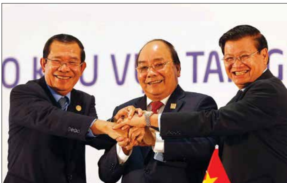
Cambodia's Prime Minister Hun Sen (L), Vietnam's Prime Minister Nguyen Xuan Phuc (C) and Lao PDR's Prime Minister Thongloun Sisoulith pose for a photo during a signing ceremony after the 10th Cambodia-Laos-Vietnam summit as part of the Greater Mekong Subregion Summit in Hanoi on 31 March, 2018.