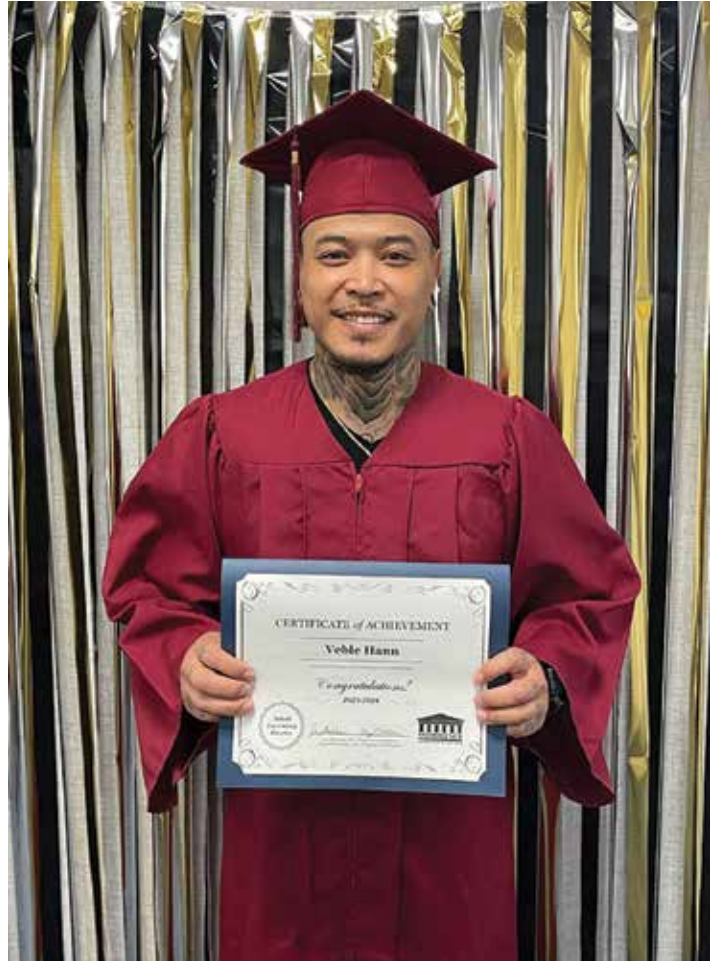
MCC បានរៀបចំពិធីមួយសម្រាប់សិស្សដែលបានទទួលវិញ្ញាបនបត្រពីវិទ្យាល័យរបស់ពួកគេតាមរយៈការប្រឡង GED® និង HiSET®

Visit www.middlesex.mass.edu/adultlearning for more information about MCC’s Adult Learning Center.