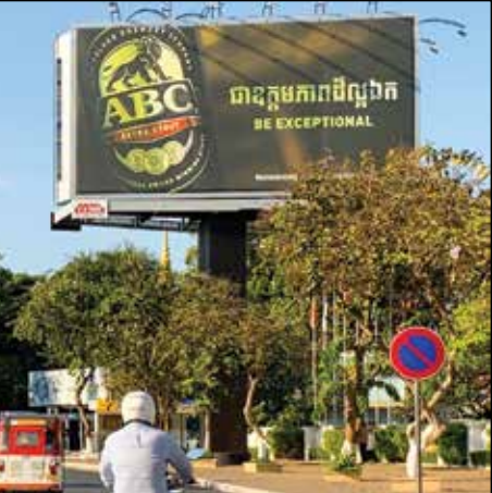
រូបឯកសារ៖ រូបភាពនៃផ្ទាំងផ្សព្វផ្សាយគ្រឿងស្រវឹង នៅតាមមហាវិថីព្រះស៊ីសុវត្ថិ ក្នុងរាជធានីភ្នំពេញ នៅថ្ងៃទី២៤ ខែមករា ឆ្នាំ២០២៤។ (លាស់ លីបលីប/ វិទ្យុអេ)

Phnom Penh - As the government sets up an Alcohol Control Working Group to control alcohol advertising, observers call for an end to alcohol advertising on billboards in public places and on the streets, as well as on television to prevent images from appearing those alcoholic products embody the feelings