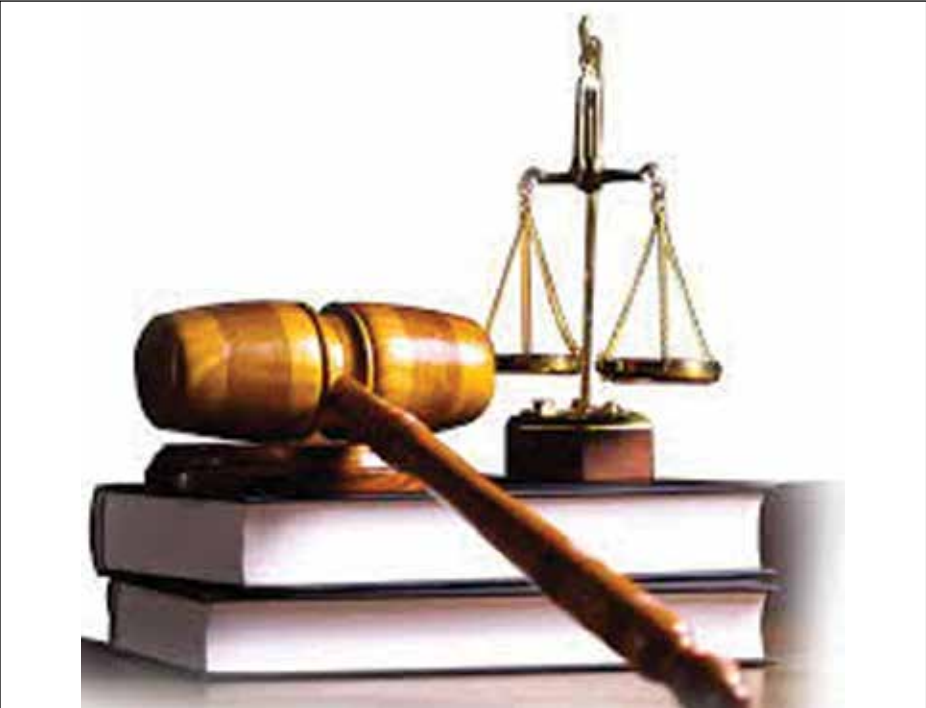
ច្បាប់របស់កម្ពុជា

With respect to the concerns raised by the opposition councilors to Human Rights Watch, the law prohibits all political parties, candidates, or supporters from threatening, intimidating, or enticing anyone to pledge their vote for any political party. In addition, political parties, candidates, or representatives