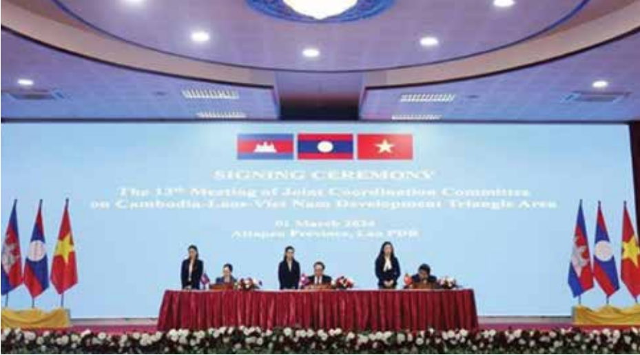
13th meeting of the Joint Coordination Committee on CLV Development Triangle Area in at Tapeu, Laos.

កេងប្រវ័ញ្ចយកធនធានធម្មជាតិរបស់ កម្ពុជា និងឡាវដូចជា ថាមពលអគ្គិសនី ឈើមាសនិងត្បូងនៅក្នុងខេត្តមណ្ឌលគីរី ពួកគេផ្តល់ប្រាក់ចំណូលតិចតួចចូល ថវិកាជាតិ។”