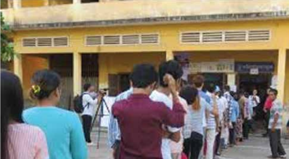
ប្រជាពលរដ្ឋចូលរួមបោះឆ្នោតជ្រើសរើសមេដឹកនាំរបស់ខ្លួន

“ភក្តី” បាននិយាយថា៖ សម្រាប់ខ្ញុំផ្ទាល់ ពេលធ្វើដំណើរ ខ្ញុំ