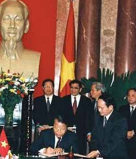
Signing ceremony between President of Russia Vladimir Putin and Vietnam President Tran Due Luong in Hanoi, 2001.

From Page 02 country and its similarities with China’s Belt and Road and the defunct USSR or the Russian Eurasian Economic Union which was supposed to be Russia’s response to the EU. It is actually colonialism happening under our nose, disguised