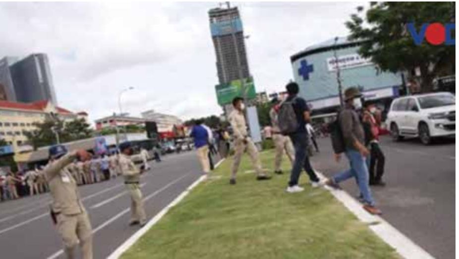
ក្រុមអ្នកសារព័ត៌មានត្រូវបានប៉ូលីសដេញចេញ

The report of the Ministry of Information on the situation of press freedom in Cambodia said it has improved from 79% better to 80%, the same or not, who went back to study, I do not know from