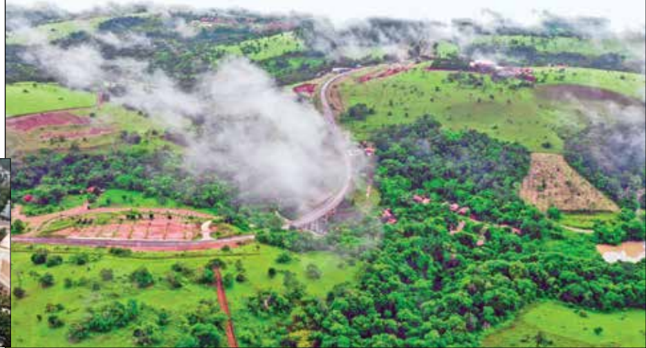
ខេត្តមណ្ឌលគិរី

population, any referendum vote would be more favorable to Vietnam, and they can come in with their military and say they come to protect their own people. Just like Russia annexing Crimea and