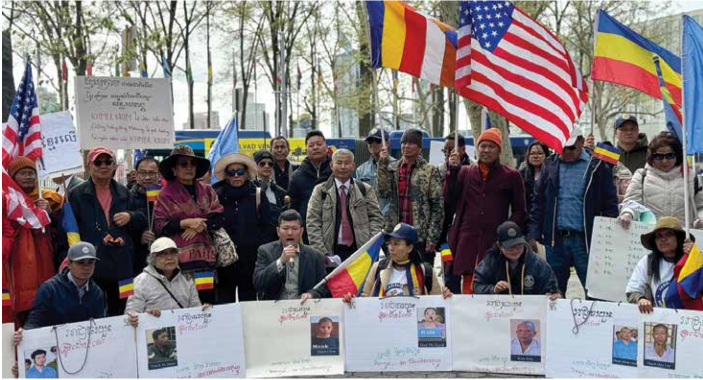
A group of 100 Khmer Krom staged protest outside of UN in New York on Friday, April 19, 2024 to demand the release of 13 Khmer Krom rights defenders who are in prison in Vietnam