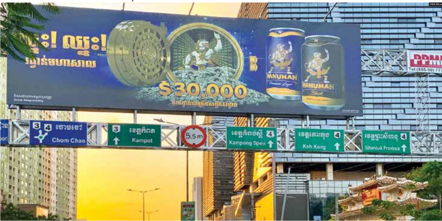
រូបឯកសារ៖ រូបភាពនៃផ្ទាំងផ្សព្វផ្សាយគ្រឿងស្រវឹង នៅតាមមហាវិថីសហព័ន្ធរុស្ស៊ី ក្នុងរាជធានីភ្នំពេញ នៅថ្ងៃទី២៤ ខែមករា ឆ្នាំ២០២៤។

អ្នកជំនាញផ្នែកសេដ្ឋកិច្ចនៅរាជបណ្ឌិត្យសភាកម្ពុជា លោក គី សេរីវឌ្ឍន៍ សាទរចំពោះការបង្កើតក្រុមការងារគ្រប់គ្រងការផ្សាយពាណិជ្ជកម្មផលិតផលគ្រឿងស្រវឹង ព្រោះក្រុមការងារនេះនឹងរួមចំណែកដល់ការត្រួតពិនិត្យឱ្យបានគ្រប់ជ្រុងជ្រោយលើការផ្សព្វផ្សាយពាណិជ្ជកម្មអំពីគ្រឿងស្រវឹង និងការកំណត់ទីតាំងដែលអាចដាក់ផ្ទាំងប៉ាណូដើម្បីលើកកម្ពស់សោភ័ណភាពទីក្រុង