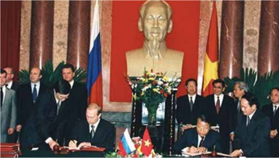
Signing ceremony between President of Russia Vladimir Putin and Vietnam President Tran Due Luong in Hanoi, 2001.

មើលពីឥទ្ធិពលរបស់វាទៅលើចំនួនប្រជាជនបរិស្ថាន សង្គមបូរណភាពទឹកដីអធិបតេយ្យភាពនៃប្រទេសទន់ខ្សោយនិងភាពស្រដៀងគ្នារបស់វាជាមួយនឹងខ្សែក្រវ៉ាត់របស់ចិន និង ផ្លូវ និងការជួល