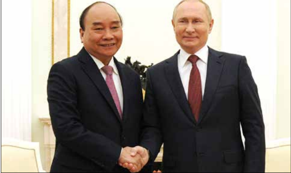
The Kremlin hosted talks between Vladimir Putin and President of the Socialist Republic of Vietnam Nguyen Xuan Phuc, 2021.

Vietnam’s domination of Southeast Asia would extend the power of China