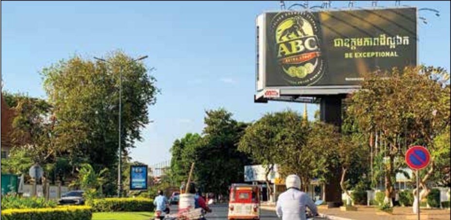
រូបឯកសារ៖ រូបភាពនៃផ្ទាំងផ្សព្វផ្សាយគ្រឿងស្រវឹង នៅតាមមហាវិថីព្រះស៊ីសុវត្ថិ ក្នុងរាជធានីភ្នំពេញ នៅថ្ងៃទី២៤ ខែមករា ឆ្នាំ២០២៤។

ប៉ះពាល់ទៅដល់យុវជន ទៅដល់យុវវ័យ កុមារជាច្រើន ដែលកំពុងតែដើរទៅរៀន ដែលកំពុងតែធ្វើដំណើរតាមដងផ្លូវផ្សេងៗ ធ្វើឱ្យគាត់អាចឃើញជិតដាមអារម្មណ៍យកគំរូតាមទៅថ្ងៃអនាគត»។ បើតាមលោក យង់ គឹមអេង ការផ្សព្វផ្សាយពាណិជ្ជកម្មគ្រឿងស្រវឹងលើផ្ទាំងប៉ាណូនៅតាមដងផ្លូវ ផ្តល់ផលប៉ះពាល់ដល់សង្គមជាពិសេសក្នុងចំណោម