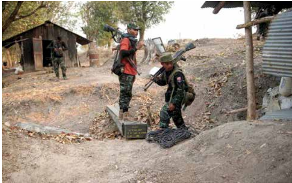
«កងឧទ្ទាមការ៉ែន យកបានហើយកាន់កាប់តំបន់មិយាភីឌី នៅជាប់ទល់ដែនថៃ»

នាក់ ប្រសាមយុទ្ធព័ទៅ៣៥ឆ្នាំ ស្រីអាយុពី១៨ទៅ២៨ឆ្នាំ តែពួកយុវជនទាំងនោះ រាប់លាននាក់ មិនចង់ចូលធ្វើ