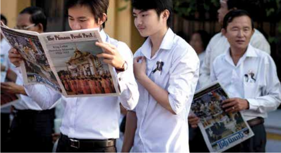
យុវជនអានកាសែតភ្នំពេញប៉ូស្ត

យោសនាឯកជន ឯទៀតជាច្រើន។ នៅពេលដែលសមាគមអ្នកសារព័ត៌មានខ្មែរ ក្រោយនេះកើតឡើងបាន១ឆ្នាំ ទាំងអស់គ្នា បានខិតខំកសាងសមិទ្ធិផលនៃរបបសេរីនេះ ឲ្យមានជំហ៊ុំរឹងប៉ឹងរួមគ្នា ដោយសិក្សាវិជ្ជានៃសារព័ត៌មានសេរីលើកទឹកចិត្តឲ្យចេញផ្សាយកាសែតឬទស្សនាវត្តិព្រាងព្រាត បង្កើតបានជាវិជ្ជាស្ថានសារព័ត៌មាន នៅសាកល