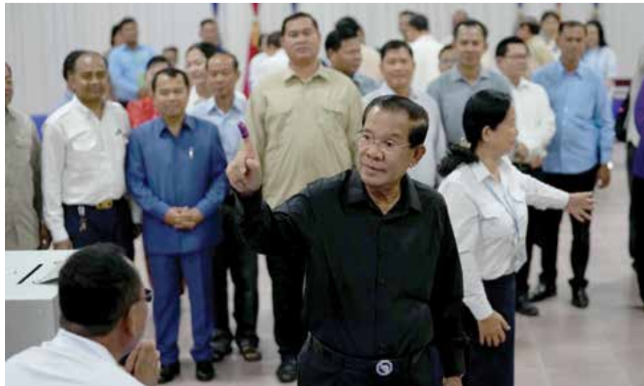
Former Cambodian Prime Minister Hun Sen after voting for the Senate election at Takhmau polling station in Kandal province, Cambodia, February 25, 2024.

បានបោះឆ្នោតអនុម័តលើលោក ហ៊ុន សែន អតីតនាយករដ្ឋមន្ត្រីដ៏យូរលង់នៃគណបក្សប្រជាជនកម្ពុជាដែលកំពុងកាន់អំណាចជាប្រធានព្រឹទ្ធសភា។