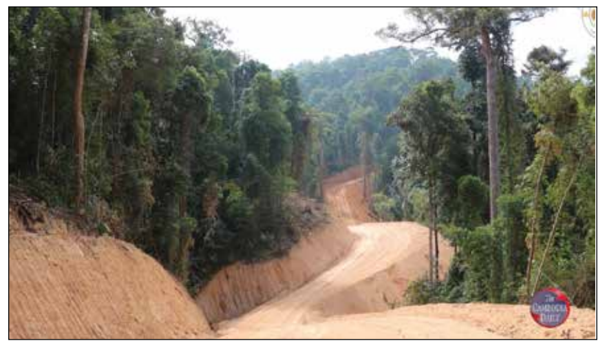
ក្រុមការងារកំពុងតែសាងសង់ផ្លូវក្រវាត់ព្រំដែន

វឌ្ឍនភាពនៃដំណើរការកសាងផ្លូវព្រំដែននៅក្នុងរយៈពេលប្រមាណ ៥ខែកន្លងមកនេះ ក.គ.ម បានបង្ហាញពីការងារឈូសព្រៃសម្រាប់រកផ្លូវខ្សែដំបូង ការឈូសផ្លូវទទឹងសម្រាប់រកអ័ក្សផ្លូវ ការលុបជ្រលង-អូរ ការបន្ទាបចំណោតភ្នំ និងការធ្វើប្រឡាយ រួមទាំងការកសាងតួផ្លូវ និងចិត្តជញ្ជាំងភ្នំ ក្រាលល្បាយកម្ទេចថ្ម ជាដើម។