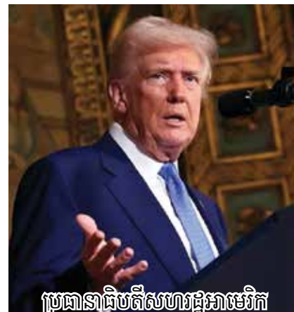
ប្រធានាធិបតីសហរដ្ឋអាមេរិក ឧណល ត្រាំ

However, the Ukrainian parliament continued to approve Zelensky as president of Ukraine until the