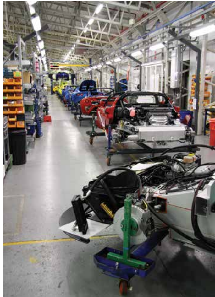
Lotus Cars assembly line as of 2008

និងកាណាដា៖ BMW, Ford, GM, Honda, Kia, Mazda, Nissan, Stel-lantis, Toyota, Volkswagen និង អ្នកផ្គត់ផ្គង់គ្រឿងបន្លាស់ថយន្តដូចជា Michelin, GM និង Toyota ។