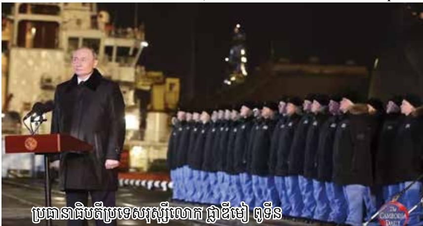
ប្រធានាធិបតីប្រទេសរុស្ស៊ីលោក វ៉ាឌីមីរ ពូទីន

ចំពោះសហរដ្ឋអាមេរិកប្រធានាធិបតី អាមេរិក លោក ដូណាល់ ត្រាំ បាន ច្រានចោលសំណើរបស់ប្រធានាធិបតី រុស្ស៊ីដែលទាមទារឱ្យប្រទេសអ៊ុយក្រែន ស្ថិតនៅក្រោមការដឹកនាំរបស់រដ្ឋាភិបាល បណ្តោះអាសន្ន