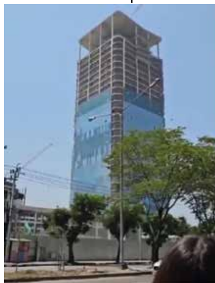
រូបរាងអាគារមុនពេលរលំបាក់

ពលករមានស្រុកកំណើតនៅ ស្រុកស្វាយអន្ទរ ខេត្តព្រៃវែងរូបនេះ បន្តថាអាគារបានយោលខ្លាំងប្រហែល ៣នាទី ធ្វើឱ្យឮសំឡេងប្រេះថ្នាក់ និងដាច់សរសៃដែករួមទាំងផ្ទះខ្សែ ភ្លើង ហើយបង្កឱ្យក្រុមកម្មករទាំង