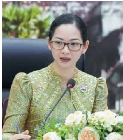
រដ្ឋមន្ត្រីក្រសួងពាណិជ្ជកម្ម អ្នកស្រី ចម នីម្មល

ប្រធានាធិបតីដ៏ថ្លៃថ្លាខ្ពង់ខ្ពស់ជាទី គោរព។ លោកថា លោកចង់ថែរក្សា