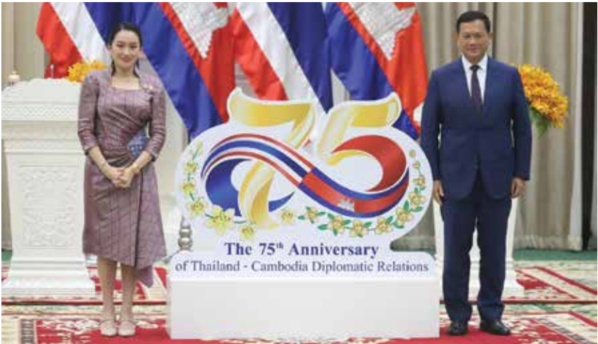
នាយករដ្ឋមន្ត្រីថៃមកទស្សនៈកិច្ចផ្លូវការនៅភ្នំពេញ

Prime Minister Hun Manet offered his thanks during an official Manet and Paetongtarn signed cooperation agreements on labor