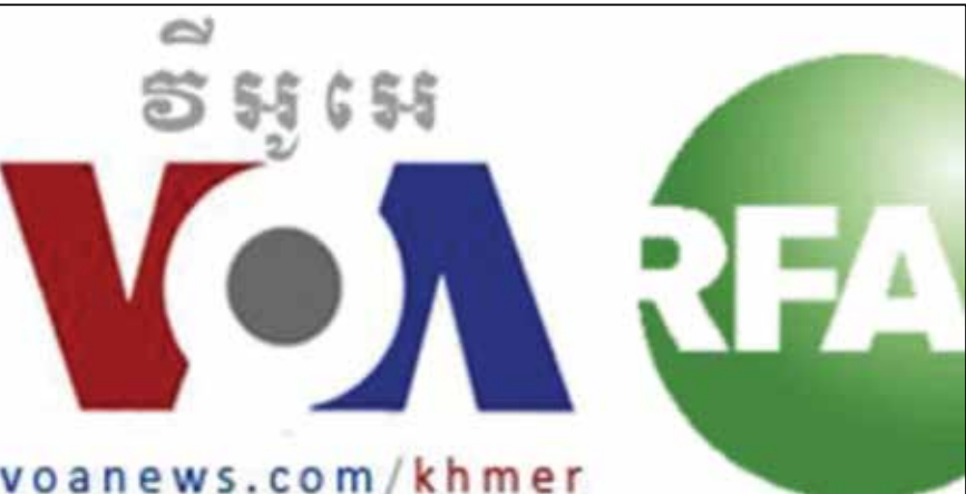
ប្រព័ន្ធផ្សព្វផ្សាយដែលទទួលមូលនិធិពីអាមេរិក

សេរី ថ្ងៃទី១៨ ខែមករា ឆ្នាំ២០២៣។