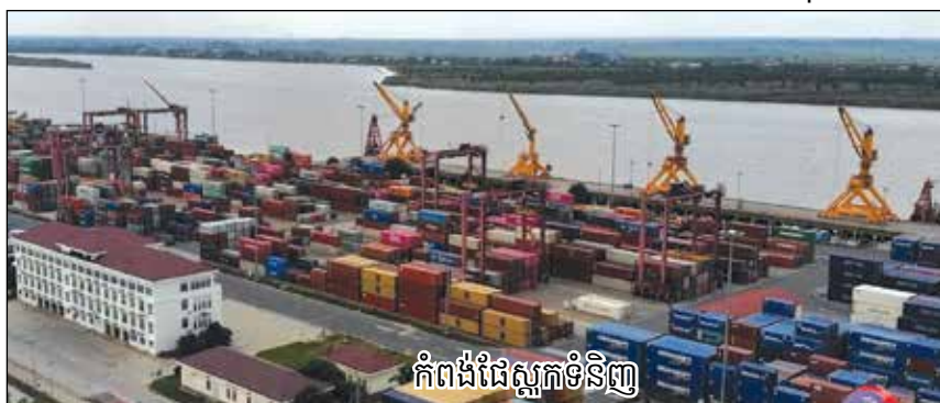
កំពង់ផែស្តុកទំនិញ

ដំណោះស្រាយចំពោះមុខ ដែលរដ្ឋាភិបាលអាមេរិកប្រកាសដំឡើងពន្ធគយដល់ ៤៩% មកលើកម្ពុជា