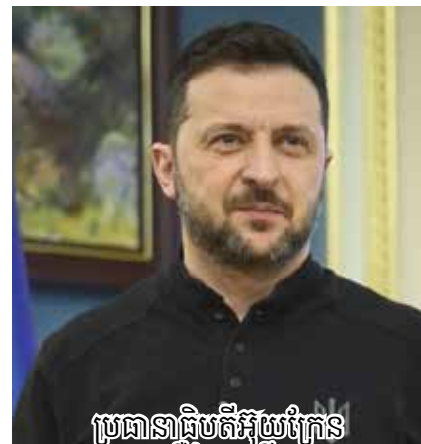
ប្រធានាធិបតីអ៊ុយក្រែន ស៊ីលេនស្គី

replace the current government led by President Volodymyr Zelensky. The Moscow Times reported