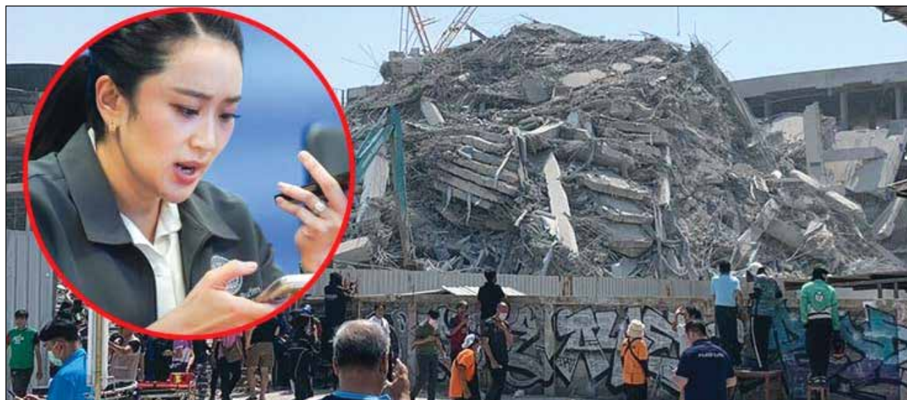
នាយករដ្ឋមន្ត្រីថៃ

CENTRAL officials say that many Cambodian workers who are missing after a building collapsed in Thailand on March 28 may be missing.