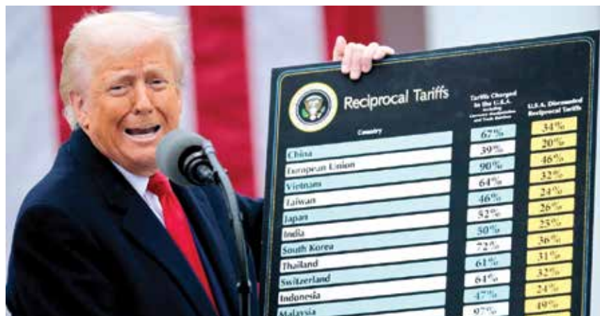
ប្រធានាធិបតីសហរដ្ឋអាមេរិកកំពុងតែបង្ហាញតារាងពន្ធ

កម្ពុជាយកពន្ធ ៩៧% នោះ តាមពិត គេគណនាតាមរបៀបការធ្វើជំនួញ មិនស្មើភាពជាមួយគ្នា។ ទំនិញដឹក ពីប្រទេសកម្ពុជា ទៅលក់នៅ សហរដ្ឋអាមេរិក មានទឹកប្រាក់ចំនួន ជិត១៣ពាន់លានដុល្លារក្នុងឆ្នាំ២០២៤