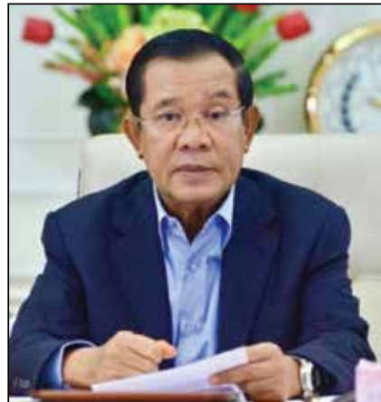
សម្តេច ហ៊ុន សែន ប្រធានព្រឹទ្ធសភា