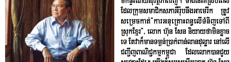
លោក កឹម សុខា ប្រធានគណបក្សសង្គ្រោះជាតិ