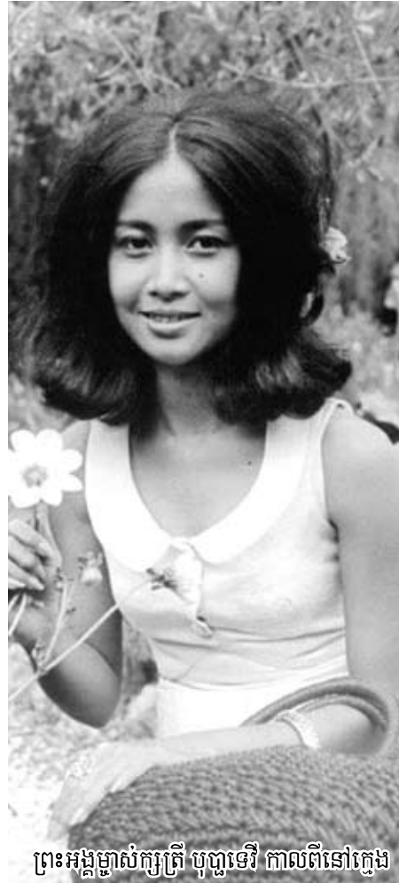
ព្រះអង្គម្ចាស់ក្សត្រី បុត្រាទេវី កាលពីនៅក្មេង

បន្ទាប់ទុកព្រះរាជបុត្រាបុត្រីចំនួន៥នាក់ ពីក្នុង ចំណោមព្រះរាជពិធីមង្គលការព្រះអង្គចំនួន៤ ។ អ្នកឱ្យប្រតិបត្តិព្រះអង្គម្ចាស់ក្សត្រីយ័នរោត្តម បុត្រាទេវី បានជួបប្រទះនូវបរមសុខ នាអនាគត