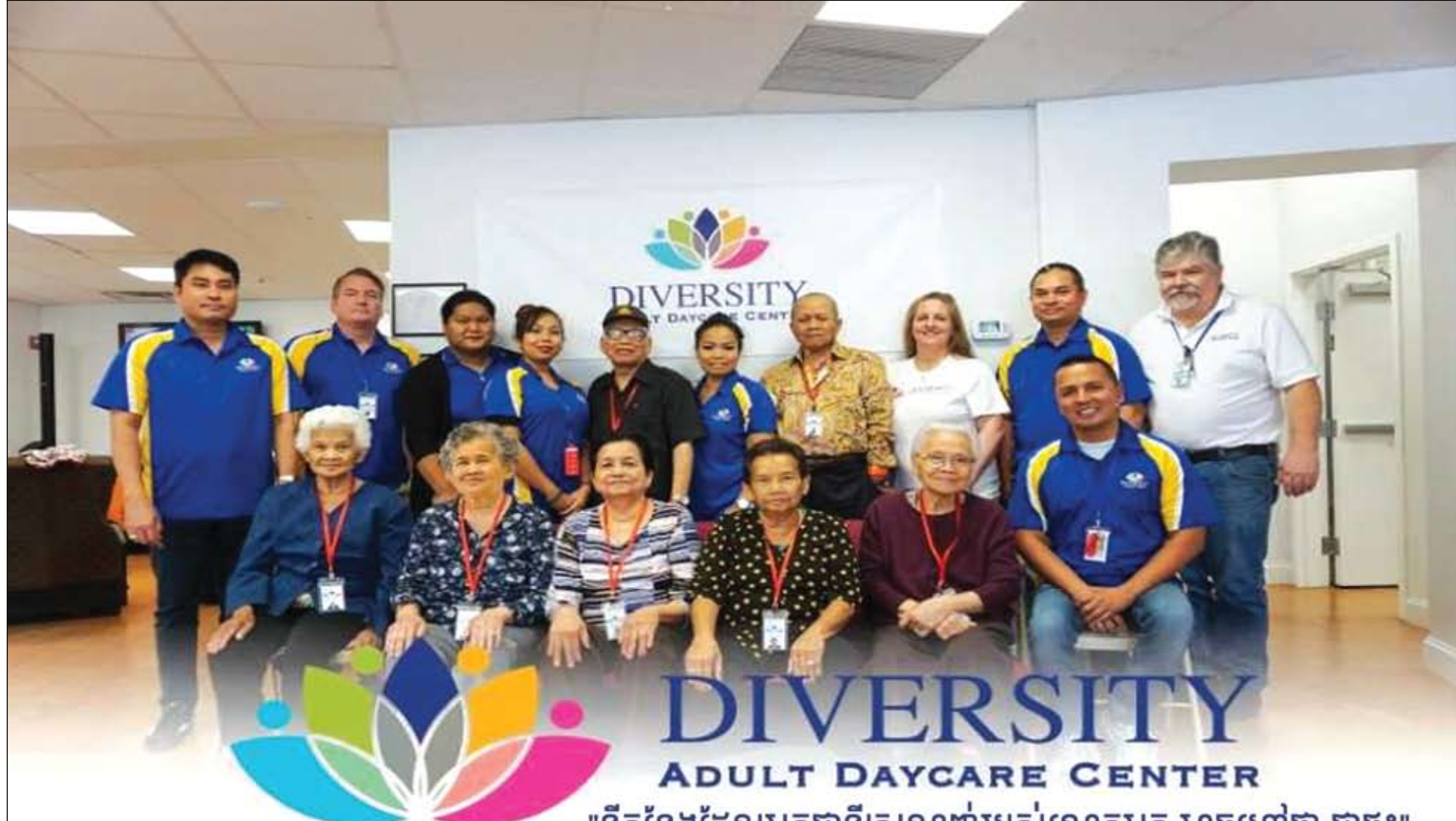
"ទីកន្លែងដែលអ្នកជាទីស្រឡាញ់របស់លោកអ្នក អាចហៅថា ជាផ្ទះ"