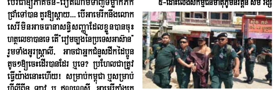
សកម្មជនមហាគុកម្មវិធីវត្ត សម រង្ស៊ី ចាប់ខ្លួននៅតំបន់ លោកនាយករដ្ឋមន្ត្រី ហ៊ុន សែន បានប្រកាសឱ្យដោះលែង

ខោស តែត្រូវធ្វើជាបន្តទៅទៀតឱ្យដល់ចុងបញ្ចប់ គឺឱ្យមានសិរិភាពជាស្ថាពរ... ព្រះអាចិយ្យលោក ហ៊ុន សែន នៅតែរង់ចាំខាងលិចតែដដែលនៅឡើយ. តើបានប្រយោជន៍អ្វីដែលមេគណបក្សម្នាក់ មិន អាចធ្វើនយោបាយនោះ. លោក ហ៊ុន សែន នៅតែ បង្ហាញថា លោកនៅខ្លាចគណបក្សប្រឆាំងនៅ ឡើយ មិនដូចពាក្យដែលគាត់និយាយនោះទេ។ មានខ្លះទៀតថា “នេះជាស្នាដៃដ៏អស្ចារ្យនៃ ព្រឹត្តិការណ៍កម្ពុជា មិនមែន សម រង្ស៊ី តែឡើយ”ហ៊ុន សែនឱ្យ សម រង្ស៊ី លេងប្រើដែលគេប្រើប្រាស់ ទៅវិញទេ”គឺលេងក្រៅវង់...ដូច្នេះកុំប្រកាសដីយ ជំនះឆាប់ពេក។