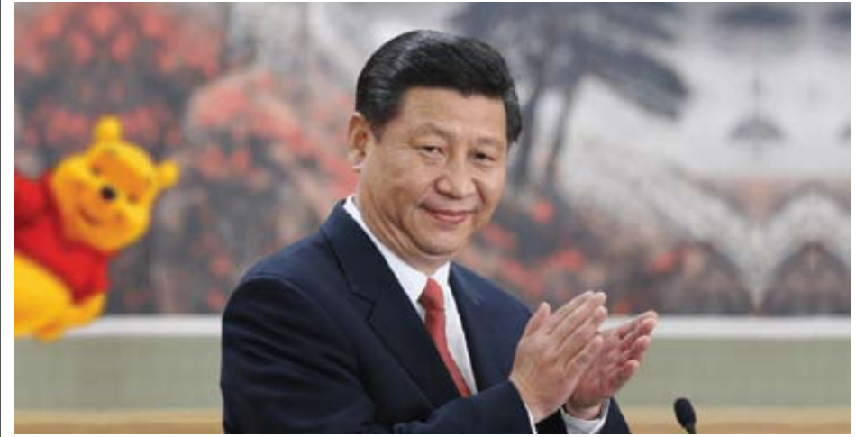
ប្រធានាធិបតី ស៊ី នៃប្រទេសចិន

៣-ករណីប្រទេសកម្ពុជាវិញ នៅកម្ពុជា ការ“ទប់ទប់”និងប្រទេសមហា អំណាចចិន បានចុះចេញដោយធាត់លំដាប់ដៃនឹងមកពី ដដែលនៅឡើយ... តែស្ថានភាពរវាង និងស្ថានភាព អាមេរិក បានប្រញាប់ប្រញាល់ធ្វើឱ្យមានព្រឹត្តិការ មួយថា “ជាការល្អហើយ ដែលបានបន្តបន្ទួល