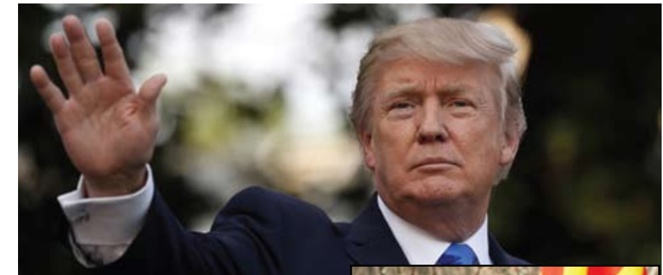
ប្រធានាធិបតី ឌុណល ត្រាំ នៃសហរដ្ឋអាមេរិក

ដោយ ពិន សំខុន លោកប្រធានាធិបតី ឌុណល ត្រាំ កំពុងតែ ត្រូវសភាដំណាងរាស្ត្រធ្វើការស៊ើបអង្កេតលើរូប លោកក្នុងបំណងដាក់លោកចេញពីដំណែងប្រ ធានាធិបតី (impeachment), ពីព្រោះលោក ត្រាំ កាំង” ដែលនេះគឺជាកំហុសដ៏ធំមួយ ដែលលោក ត្រាំ ប៉ូឡូស៊ី ប្រធានគណបក្សប្រជាធិបតេយ្យប្រចាំ សភាមិនអាចរំលងឱកាសដ៏ល្អនេះបាន។ ១-សួរដេញដោលម្នាក់ត្រាំពីដំណែង នៅពេលដែលគណបក្សការសភា កំពុងតែ