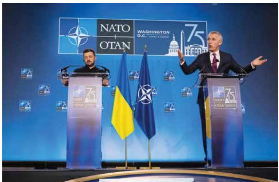
ប្រធានាធិបតីអង្គការ រដ្ឋស្រីលី ជេឡិនស្កី និងអគ្គលេខាធិការណេតូ លោក ជិន ស្លែលតិនប៊ែក នៅរដ្ឋធានីវ៉ាស៊ីនតុន

អឺរ៉ុប ថ្ងៃទី១០កក្កដា២០២៤ មហាសន្និបាតកំពូលទី៧៥ របស់អង្គការ«ម្ដីភ្នំ»ឬក៏ហៅម្យ៉ាងទៀតថា«ណេតូ»សម្រាប់ឆ្នាំ២០២៤ បានប្រព្រឹត្តទៅនៅរដ្ឋធានីវ៉ាស៊ីនតុន នៃ