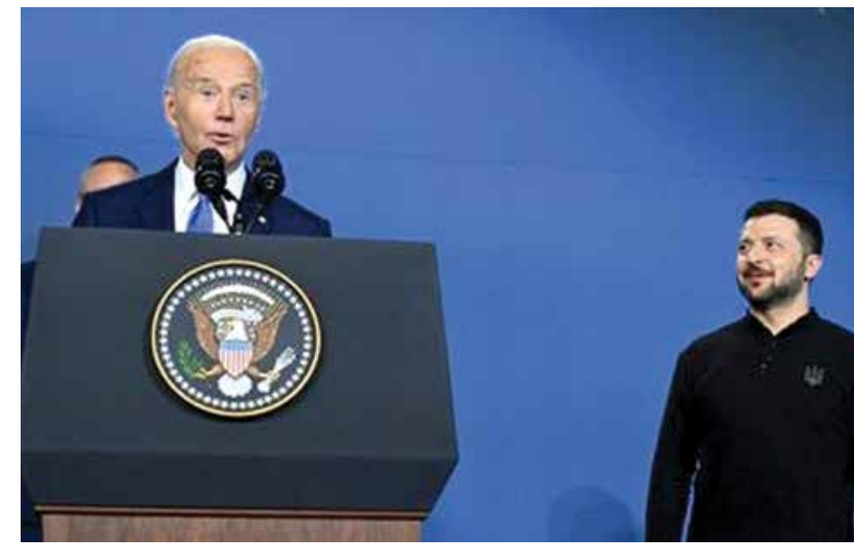
ប្រធានាធិបតីអង្គការ រដ្ឋស្រីលី ជេឡិនស្កី និងប្រធានាធិបតីសហរដ្ឋអាមេរិក ចូបៃ ឌិន

រាប់ទាំងប្រព័ន្ធការពារ«នូក្លេអ៊ែរ»ទៀតផង នោះ «ណេតូ»បានស្វាគមន៍សមាជិកថ្មី ដែលនៅជាប់នឹងព្រំដែនប្រទេសរុស្ស៊ី គឺប្រទេសស៊ែរីអាដ និង ហ្វាំងឡង់, «ណេតូ»បានផ្តោលទោសប្រទេសរុស្ស៊ីយ៉ាងចំពោះមុខថា«ជាប្រទេសដែល