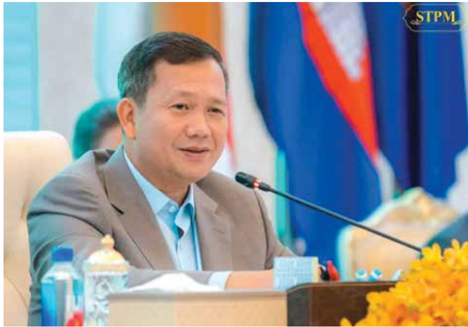
លោកនាយករដ្ឋមន្ត្រី ហ៊ុន ម៉ាណែត