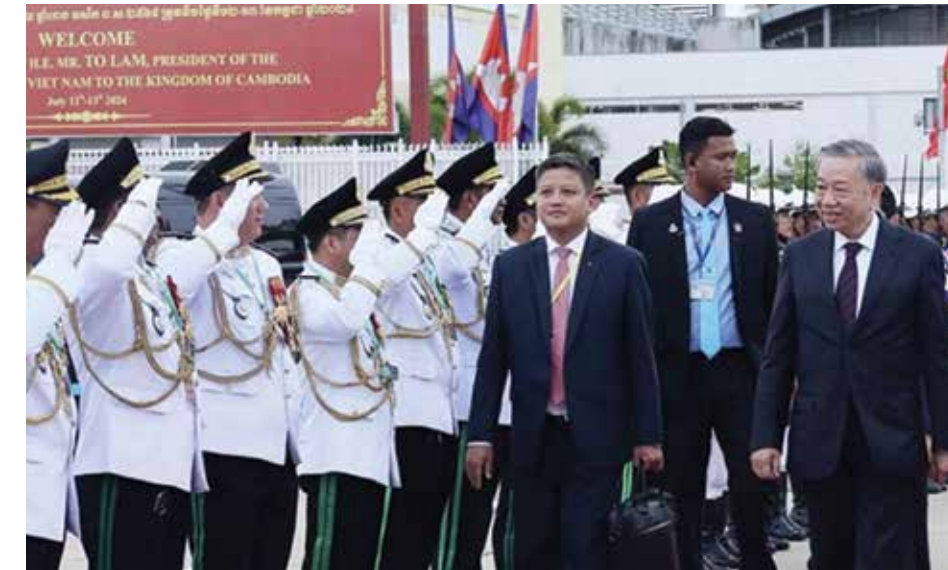
President To Lam (right) concluded his successful state visit to Cambodia on July 13. He was given a warm send-off by several senior ministers and government officials.

បុណ្យទេ។ មិត្តភាពជាមួយវៀតណាមត្រូវបានលោក ហ៊ុន សែន ការពារយ៉ាងខ្លាំង