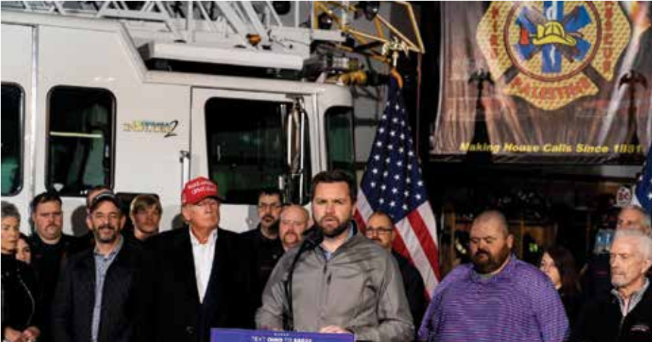
ឧណល ត្រាំ (ពាក់មួកក្រហម) ជេឌី ប៊ីន(ពាក់អាវប្រផេះ)ជាបេក្ខជនប្រធានាធិបតី និងអនុ ប្រធានាធិបតី ខាងគណបក្សសាធារណរដ្ឋ

ជាប់ឆ្នោតជាបេក្ខនារីប្រធានាធិបតីផ្លូវការ ហើយ លោកស្រី កាម៉ាឡា ត្រូវជ្រើស យកដៃគូរួមដំណើរជាបេក្ខជនអនុ ប្រធានាធិបតី យ៉ាងប្រុងប្រយ័ត្នចុងបញ្ចប់ សម្រេចយកលោក ធីម វ៉ល អភិបាល រដ្ឋមន្ត្រីសូតា អាយុ៦០ឆ្នាំជាដៃគូប្រកួត តទល់នឹងបេក្ខជនប្រធានាធិបតីខាង គណបក្សសាធារណរដ្ឋ ឧណល ត្រាំ និង ជេឌី ប៊ីន ។