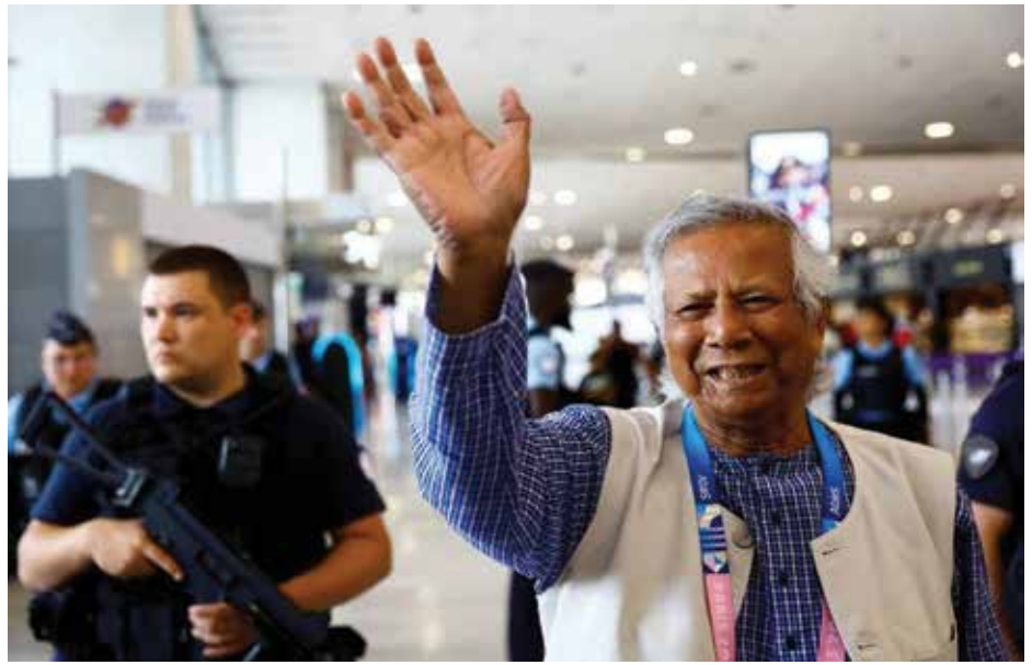
លោក មហាម៉ាត់ យ៉ានីស ជួយលោកស្រីលោកស្រី២០០៦ចតនៅចំណត អាសយដ្ឋាន សាលាឌីក្រោល បារីស(វ័យទំរ) ពេលលោកកំពុងចូលរួមទស្សនាកីឡាអូឡាំពិក២០២៤ហើយត្រូវត្រឡប់ជាបន្ទាន់មក បង់ក្លាដេសវិញ

ចោល ហើយនយោបាយដែលធ្លាប់តែកាតាលោកស្រី ហាស៊ីណា ក៏ចេញទៅចរចាជាមួយក្រុមបាតុករ ដែលជាក្រុមយុវជននិស្សិតភ្លាមដែរ។ ថ្ងៃទី៦សីហា ក្រុមបាតុករនិស្សិតក៏បានទាមទារ ឲ្យមានការប្តូរអំណាចដោយអញ្ជើញដំណើរការនៃលោកស្រី គឺលោកមហាម៉ាត់ យ៉ានីស ដែលពួកគេទុកចិត្តឲ្យមកកាន់ដំណែងបណ្តោះអាសន្នដើម្បីរៀបចំអំណាចរដ្ឋសាជាថ្មីឡើងវិញ។ លោក មហាម៉ាត់ យ៉ានីស ជាជ័យលាភីលោកស្រី២០០៦ដោយសារជោគជ័យនៃកម្មវិធីជំនួយសេដ្ឋកិច្ចខ្នាតតូចនៅរបស់លោក នៅបង់ក្លាដេស ពីស្នាដៃនោះលោកក៏បានទទួលពានរង្វាន់