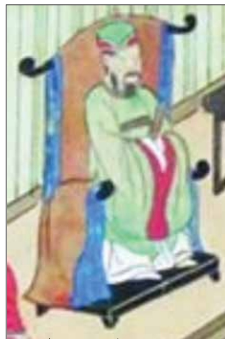
Lord Nguyen Phu Nguyen 1616-1635

ព្រៃនគរ (សៃព្តាន) និងអនុញ្ញាតឲ្យប្រមូលពន្ធនៅឆ្នាំ ១៦២៣ ដែលជាបិការរបស់