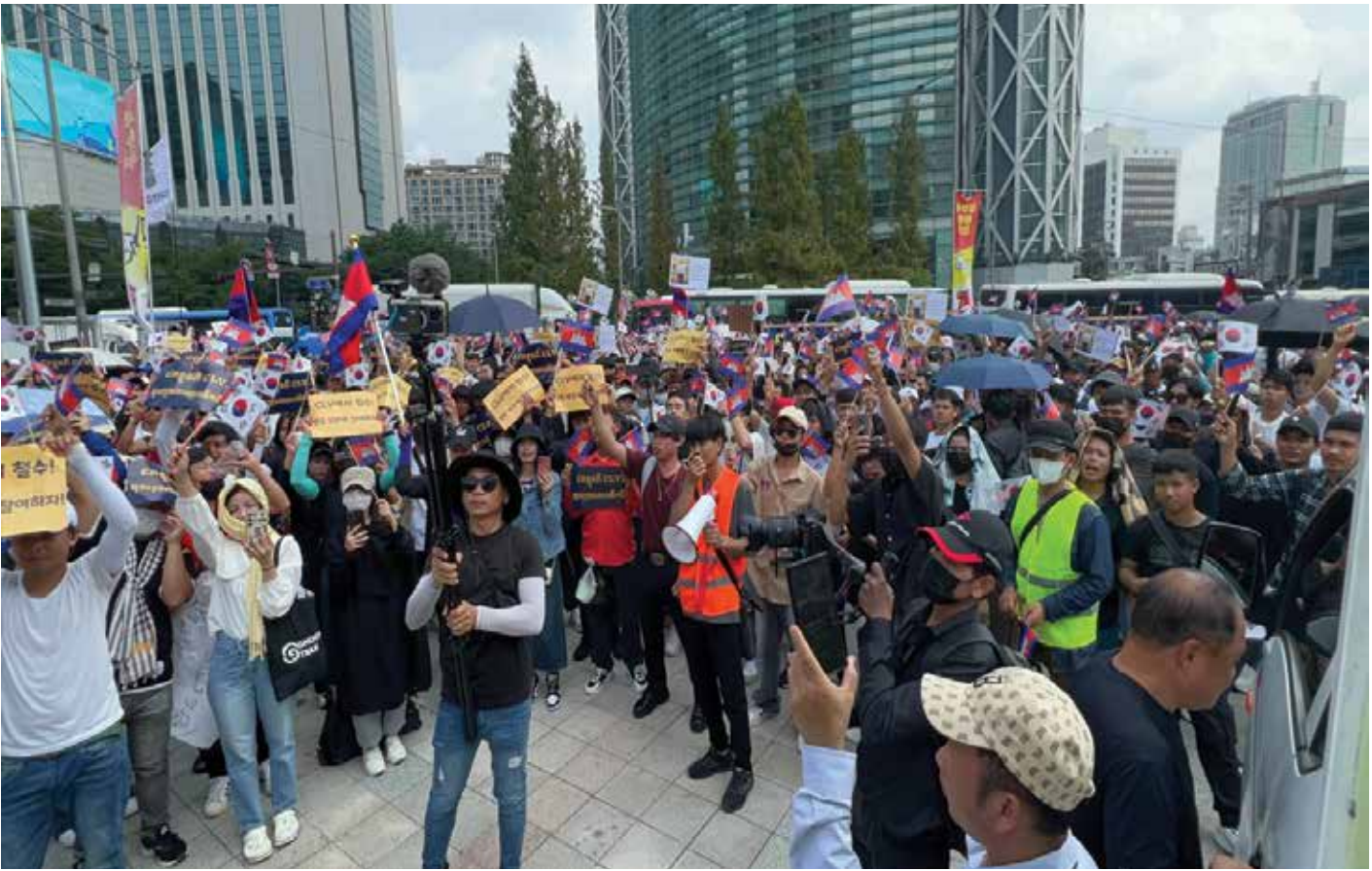
ប្រជាពលរដ្ឋខ្មែររស់នៅប្រទេសកូរ៉េខាងត្បូងនាំគ្នាធ្វើបាតុកម្មប្រឆាំងនឹងគំរោងអភិវឌ្ឍ ត្រីកោណខ្មែរ លាវ និងវៀតណាម

ជាលំដាប់ ។ ហេតុអ្វីក៏រៀងរៀងណាម យកដីខ្មែរ ផ្ទះនៅពេលនេះ? ថ្មីៗនេះ បញ្ហាសង់ព្រែកដីហូណាន់ មានការចំរុះចំរាស់ជាមួយនឹងវៀតណាម ពុំដឹងមកពីហេតុអ្វី តែភាគីខាងខ្មែរវិញ សម្រុកចង់តែសង់ ដោយមិនខ្វល់ពីកង្វល់ វៀតណាមផងទេ, ជាមួយគ្នានោះ បញ្ហា គំនូសព្រំប្រទល់ដែនគឺមិនទាន់ចប់ សព្វគ្រប់ដែលបញ្ហាដែនសមុទ្រប្រវត្តិសាស្ត្រ ក៏ហាក់ចេញមកវិញ ជាមួយនឹងព្រែកជីក