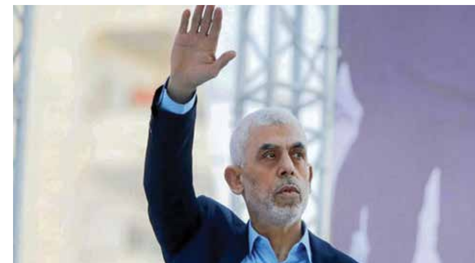
យ៉ាយ៉ា ស៊ីនវ៉ា ប្រមុខក្រុមហាម៉ាស ទើបតែងតាំងថ្មី

ដែលមិនព្រមឈប់ប្រឹងប្រែងឲ្យមាន កិច្ចចរចាឈប់បាញ់គ្នាជាបន្ទាន់ គឺ សហរដ្ឋអាមេរិក ប្រទេសអេដីប និង ប្រទេសកាតាពីព្រោះគេបានមើលឃើញ ថា សង្គ្រាមអាចនឹងផ្ទុះយ៉ាងខ្លាំងនៅ មជ្ឈិមបូព៌ា បើមិនដាក់គំនាបខ្លាំងពេលនេះ ទេ។