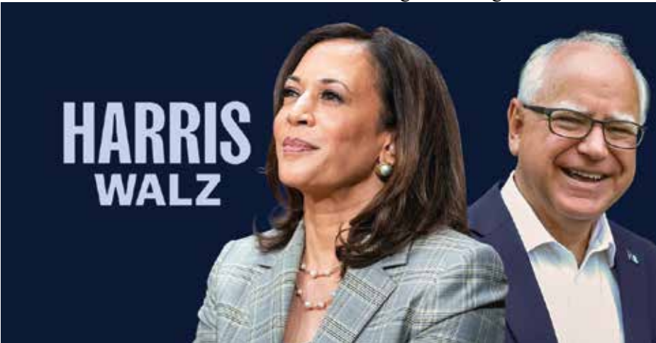
បេក្ខជនអនុប្រធានាធិបតីរបស់ កាម៉ាឡា ហារីស គឺលោក ធីម វ៉ល ខាងគណបក្សប្រជាធិបតី

តែងទទួលបាននូវការកោតសរសើរពីសា ធារណជន ហើយបានជាប់ឆ្នោតនៅ គ្រប់ដំណែងដែលលោកស្រីប៉ងប្រាថ្នា។ នៅសប្តាហ៍ទី២ បន្ទាប់ពីដឹងថាបាន