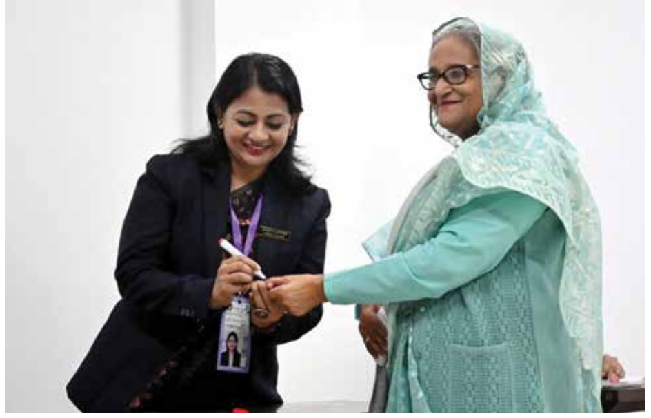
Sheik Hasina Bangladesh Priminister (bleu)