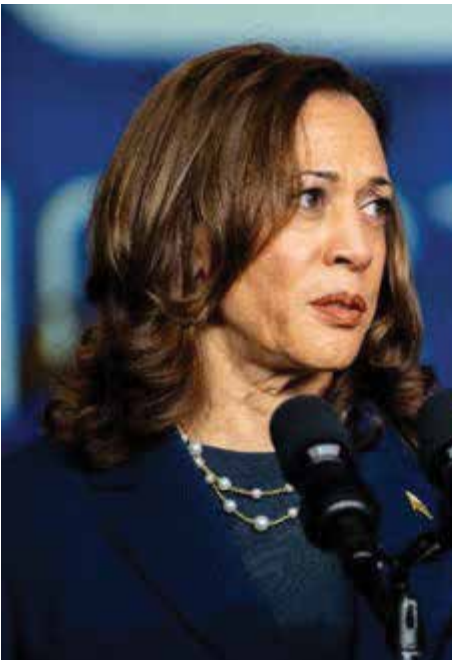
លោកស្រី កាមាឡា ហារីស អនុប្រធានាធិបតី លោក ឧណាល ត្រាំ អតីតប្រធានាធិបតី ជាបេក្ខជនសម្រាប់ប្រជែងគ្នាក្នុងដំណែងប្រធានាធិបតីសហរដ្ឋអាមេរិក ថ្ងៃទី០៥ ខែ វិច្ឆិកា ឆ្នាំ២០២៤

ជាអនុប្រធានាធិបតីកាមាឡាមិនសូវចេញមុខមាត់ទេ នៅតែក្រោមម្លប់លោកដោយ ជិនរហូត ដែលជាហេតុធ្វើឲ្យគេឯងបារម្ភថា នាង កាមាឡា មិនមានសមត្ថភាពគ្រប់គ្រាន់សម្រាប់ទប់ទល់នឹង លោក ឧណាល ត្រាំ បានទេ ។