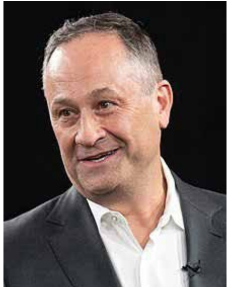
លោក ឌុកត្លាស អ៊ឹមហ្វុន(មេធាវី) ជាស្នាមីកាមេឡា ហារីស នៅឡើយក៏ដោយក្តី ។ តើ កាមាឡា ហារីស មានក្តីសង្ឃឹមច្រើនឬទេ?

មិនមានភាពច្របូកច្របល់ទៀតទេ ដោយ កាមាឡា ហារីស បានទទួលការបោះឆ្នោត លើសពីពាក់កណ្តាលនៃដំណាងសមាជិកគ្រប់រដ្ឋ៤៥០នាក់ រួចហើយថ្មីគ្រប់តែមិនទាន់បានទទួលការតែងតាំងពីសន្និបាតបក្ស ដែលនឹងប្រព្រឹត្តទៅ នៅថ្ងៃ២២សីហា ខាងមុខ