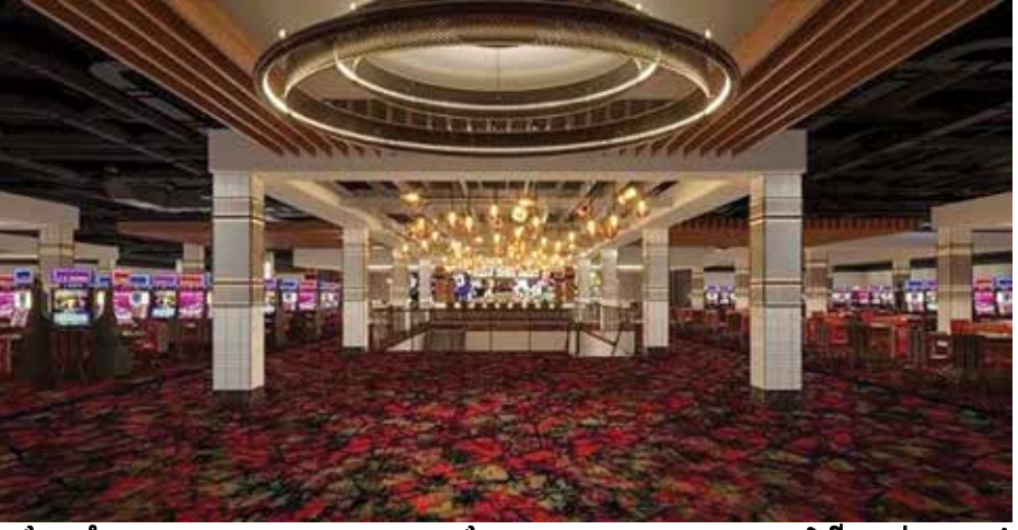
កន្លែងកំសាន្ត ECL ប្រកាសឈ្មោះកន្លែងលេងហ្គេមសប្បុរសធម៌ថ្មីរបស់ខ្លួននៅ អតីតអគារ Sears នៅផ្សារទំនើប Pheasant Lane Mall: “កាស៊ីណូ The Nash”

Nashua, NH – ECL Entertainment announces the name of its new charitable gaming venue in the former Sears building at Pheasant Lane Mall: "The Nash Casino." This state-of-the-art facility will