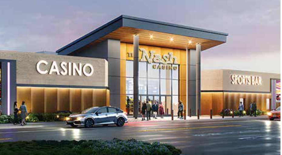
កន្លែងកំសាន្ត ECL គឺជាក្រុមហ៊ុនហ្គេម និងកម្សាន្តលំដាប់ខ្ពស់ដែលមាន មូលដ្ឋាននៅទីក្រុងឡាស វេហ្គាស Las Vegas

transform 130,000 square feet of the 180,000-square-foot, two-story building into New Hampshire's largest charitable gaming operation. Once open, it is expected to generate approximately $24 million annually for over 100 local