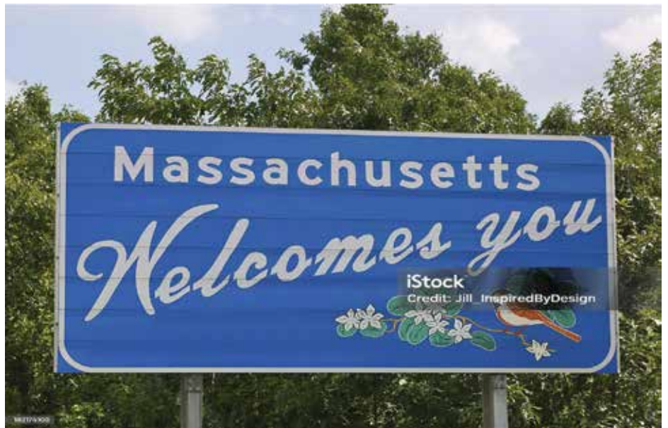
Massachusetts Welcomes you

នេះ រដ្ឋ ម៉ាសាឈូសេត គឺជាកន្លែងសម្រាប់កម្លាំងពលកម្ម ដែលមានការអប់រំច្រើនបំផុតនៅក្នុងប្រទេស។ រដ្ឋម៉ាសាឈូសេតបន្តជាប់ចំណាត់ថ្នាក់លេខ ១ សម្រាប់ការអប់រំមានសាលារៀន និងសាកលវិទ្យាល័យល្អបំផុត និងឈានមុខគេក្នុងប្រទេសលើការជោគជ័យរបស់សិស្ស។ ការអប់រំគឺជាការផ្តោតជាអាទិភាពសម្រាប់ការគ្រប់គ្រងរបស់អភិបាល ហ្វៀលី ឌ្រីសខូល លើការអប់រំដំបូង និងការថែទាំកុមារតាមរយៈការអប់រំថ្នាក់កម្រិតខ្ពស់។ ខណៈដែលការផ្តល់មូលនិធិរបស់សហព័ន្ធបញ្ចប់ រដ្ឋ