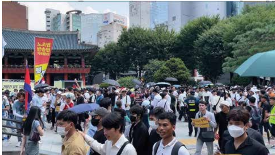
លើកនេះ ក្រុមបាតុករមិនបានរង់ចាំមេដឹកនាំ ឬបក្សប្រឆាំងណាមកដឹកនាំគេទេ គេធ្វើដោយឆន្ទៈផ្ទាល់ខ្លួន ហើយយល់ស្របដូចគ្នាថា គ្រោះថ្នាក់មកដល់ប្រជាជាតិហើយ បើមិននាំគ្នា

ការទំទាត់ និងប្រឆាំងយ៉ាងខ្លាំងខ្លាច ចំពោះគម្រោងអភិវឌ្ឍន៍ត្រីកោណនោះ ពីសំណាក់យុវជនយុវនារីជានិស្សិតឬជាកម្មករកសិករ គ្រប់ទីកន្លែង ទាំងក្នុងនិងក្រៅប្រទេស ទាមទារឲ្យដកកម្ពុជាចេញពីកិច្ចព្រមព្រៀងទាំង៣ប្រទេស ព្រោះអ្នកទាំងនោះយល់ស្របគ្នាថា «ការដាក់ថ្លៃដីរកស៊ីចូលគ្នាជាមួយនឹងវៀតណាម ខ្មែរនឹងបាត់បង់ទឹកដីទៅឲ្យវៀតណាមនៅថ្ងៃណាមួយជាមិនខាន» ដោយយោងតាមហេតុថា ពីអតីតកាលមក វាយ៉ាងដូច្នោះឯង។