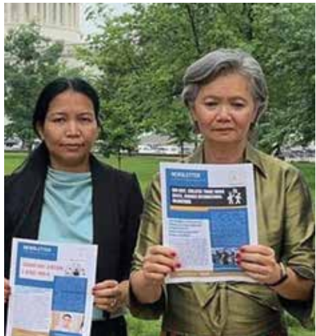
ចលនាខ្មែរដើម្បីប្រជាធិបតេយ្យ (Khmer Movement For Democracy តទៅទំព័រទី០៤

ចលនា KMD យុទ្ធជាតិស៊ីរី ជាមួយពលរដ្ឋខ្មែររហូតដល់ សិទ្ធិជាមូលដ្ឋានរបស់ពលរដ្ឋ ត្រូវបានស្តារឡើងវិញ