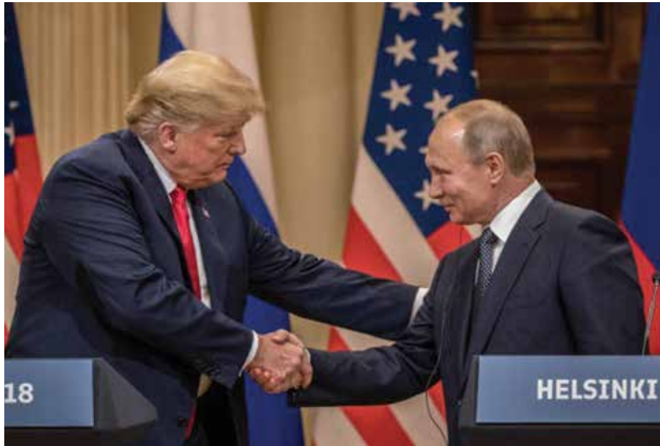
President Donald Trump & President Vladimir Putin

នខាងលិច ចំនួន២០%ហើយ គឺ: ១ តំបន់ដូណេស ២ តំបន់លូហាង្ស ៣ តំបន់