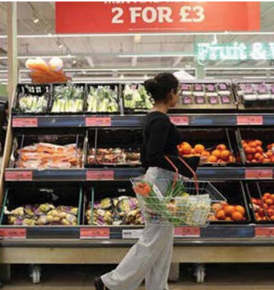
ទំនិញឡើងថ្លៃ ជាបុព្វហេតុម្យង ធ្វើឲ្យគេជនក្រីក្រ ជឿថា ឧណាល ត្រាំ ពូកែជាង កាម៉ាឡា ហារីស

គណបក្សប្រជាធិបតេយ្យ ខាង កាម៉ាឡា ហារីស តែងតែទទួលការគាំទ្រ ដោយប្រជាពលរដ្ឋក្រីក្រ និងអ្នកមានចំណូលតិច ជាដំរាប ដែលធ្វើឲ្យការស្ទង់មតិ បានឲ្យ កាម៉ាឡា បានឈ្នះ៣%, ប៉ុន្តែស្រាប់តែពេលបោះឆ្នោតមកដល់ភ្លាម ប្រជាពលរដ្ឋទាំងនោះ មានក្រុមជនជាតិភាគតិច មានស្បែកខ្មៅ ស្បែកស ឬ អាស៊ី អាមេរិកាំង ក៏បានប្រែប្រួលចិត្ត នាំគ្នាយ៉ាងច្រើន ទៅបោះឆ្នោតឲ្យ ឧណាល ត្រាំ ទៅវិញ។ ទាំងនោះហើយដែលនាំឲ្យ មតិនៅមុនពេលបោះឆ្នោត គេគិតថាក្រុម ជនជាតិភាគតិច នឹងក្រុមប្រជាជនក្រីក្រ និងបោះឆ្នោតឲ្យ «កាម៉ាឡា», ប៉ុន្តែនោះ ជាការភ័យខ្លាចខ្លះ ដែលសម្រាប់ថ្ងៃបោះឆ្នោត អ្នកទាំងនោះ បែរជារៀសម្តីទ្រ គោះបស់បោករបស់ «ឧណាល ត្រាំ» ថាជាមនុស្សដែលហ៊ានធ្វើឲ្យ «ជីវភាពនៅអា មេរិកប្រសើរឡើងបាន» នោះហើយដែលធ្វើឲ្យសន្លឹកឆ្នោត ត្រាំ ឡើងឈ្នះបាន ប្រមាណជាង ២លានសម្លេង តែប៉ុណ្ណោះ គឺជាសម្លេងបោះឆ្នោតប្រវត្តិសាស្ត្រថ្មី ដ៏ប្រកិតគ្នាជាទីបំផុត ។