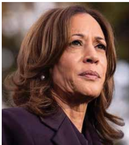
អនុប្រធានាធិបតីណា កាម៉ាឡា ហារីស