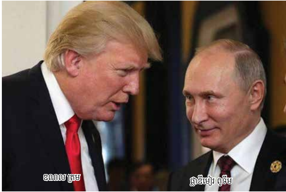
ខណាល ត្រាំ

ន លោក ជេឡិនស្គី ក៏ប្រញាប់ចង់ តំបន់ខាងកើតអ៊ូក្រែនជាបណ្តោះអាសន្ន បញ្ចប់ទំនាស់ដោយផ្អែកកាលពីថ្ងៃសៅរ៍ ប៉ុន្តែ... ទាល់តែអង្គការយោធាអឺរ៉ុបគឺ