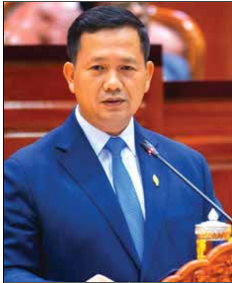
លោកនាយករដ្ឋមន្ត្រី ហ៊ុន ម៉ាណែត

លោក ហ៊ុន សែន អះអាងថា ពួក រដ្ឋាភិបាលនិរទេសមិនហ៊ានប្រកាស ទេ។ លោកថា បើពួកគេហ៊ានចេញ