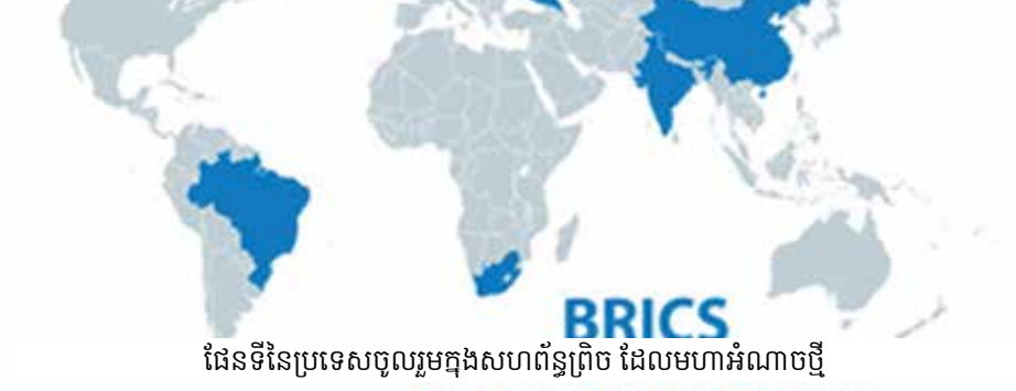
ផែនទីនៃប្រទេសចូលរួមក្នុងសហព័ន្ធព្រឹក ដែលមហាអំណាចថ្មី

ឥណ្ឌាទៀតផង ដែលសម្រេចចិនខាងត្បូង ដែលជាសម្រេចអន្តរជាតិ ក៏បានត្រូវពួក កុម្មុយនិស្តរំលោភកាន់កាប់នាពេលនោះ។ មិនបានដូចមុនទៀតទេ»។ ក្នុង២ខែ ទៅមុខ នៅពេលលោក បាយដិន ចាកចេញពីសេដ្ឋីមាន លោក ឧណាល