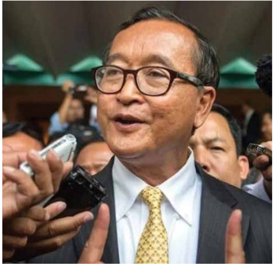
លោក សម រង្ស៊ី និរទេសខ្លួន ព្យាករណ៍ថា ហ៊ុន សែន នឹងរលំ

អតីតមេដឹកនាំបក្សប្រឆាំងរូបនេះ ថាជា "ក្រុមភេរវករ" ឬក្រុមឧទ្ធាមដែរ។ បញ្ជាក់ថា ដោយសារតែការភ័យខ្លាច ក្រោយផ្តល់រំលំបបផ្តាច់ការ លោក និងយុទ្ធសាស្ត្រផ្តារកំណើន លោក ហ៊ុន សែន បាល់សាល អាសាដ (Bashar Al-