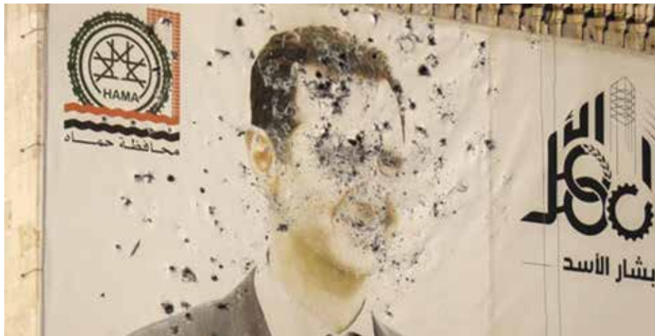
Insurgents are pursuing a shock offensive that has quickly captured not just Aleppo, but other key cities across the country's northwest and in the south, reaching the suburbs of the capital Damascus.

ប្រទេសអ៊ីរ៉ង់ ជាមហាអំណាចអ៊ីស្លាម មួយនៅក្នុងតំបន់ ឲ្យមកជួយថែមទៀត ។ លោក អាសាត បានបង្កើនសម្ព័ន្ធមិត្ត ជំនាញសាហាវថ្មីទៀត មកពីប្រទេស