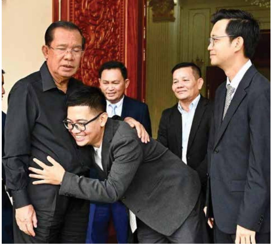
សម្តេច ហ៊ុន សែន ជួបជាមួយនិស្សិតខ្មែរនៅប្រទេសអារ៉ាប់រួម

តំណែងត្រូវបានដល់អ្នកទាំងនោះតាមក្រសួងស្ថាប័ននីមួយៗគ្រប់ៗគ្នា ដោយតែងតាំងជារដ្ឋលេខាធិការ អនុរដ្ឋលេខាធិការ ទីប្រឹក្សាឬជំនួយការជាដើម។