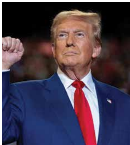
ប្រធានាធិបតីជាប់ឆ្នោត២០២៤ ឧណាល ត្រាំ

ក្នុងពេលដែលឧណាលត្រាំ រលំជ្រើសរើសគណបក្សប្រឆាំងលើក សម្រាប់ អាណត្តិថ្មី ពលរដ្ឋអាមេរិកាំងជាច្រើនមានចម្ងល់ថា «ហេតុអ្វីឯណាបានជា លោកស្រីអនុប្រធានាធិបតី កាម៉ាឡា ចាញ់ឆ្នោត លោកអតីតប្រធានាធិបតី ត្រាំ