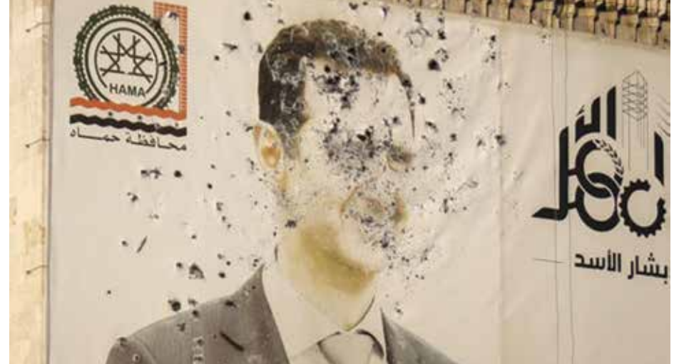
សូមអានអត្ថបទទាំងស្រុងទំព័រទី១៤

ចលនា KMD យុទ្ធជាតិស៊ីរី ជាមួយពលរដ្ឋខ្មែររហូតដល់ សិទ្ធិជាមូលដ្ឋានរបស់ពលរដ្ឋ ត្រូវបានស្តារឡើងវិញ