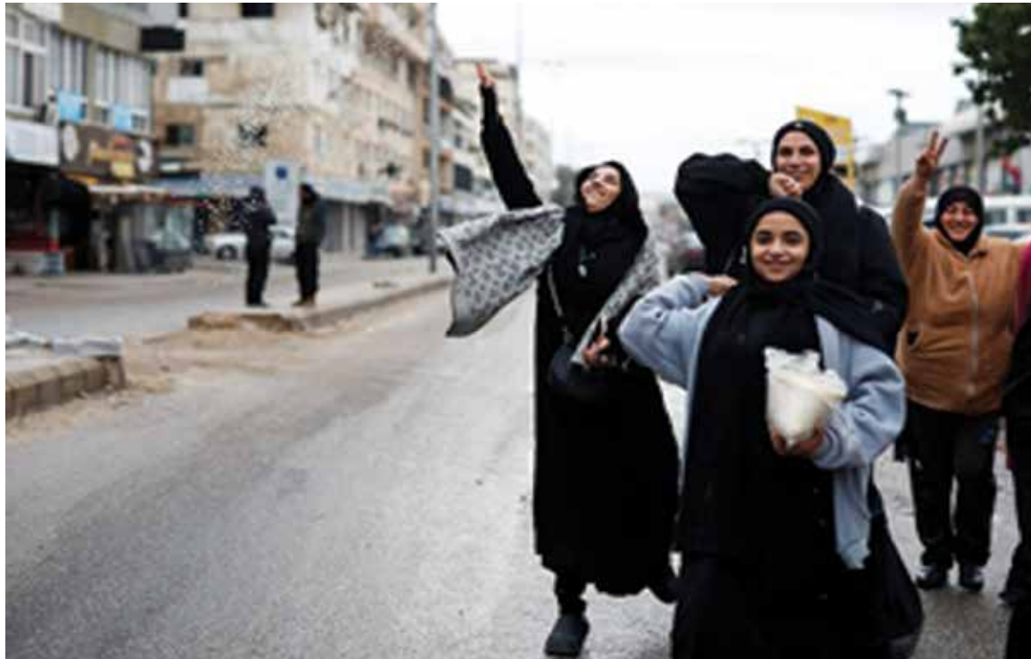
ពលរដ្ឋលីបង់ (លីបាណុន) រីករាយនឹងទទួលបានការឈប់បាញ់គ្នានៅក្បែរព្រំប្រទល់ជាមួយអ៊ីស្រាអែល

នេះ លោក ណេតាញ៉ាហ្វី បានចេញ សេចក្តីថ្លែងការណ៍យល់ព្រមលើសេចក្តី