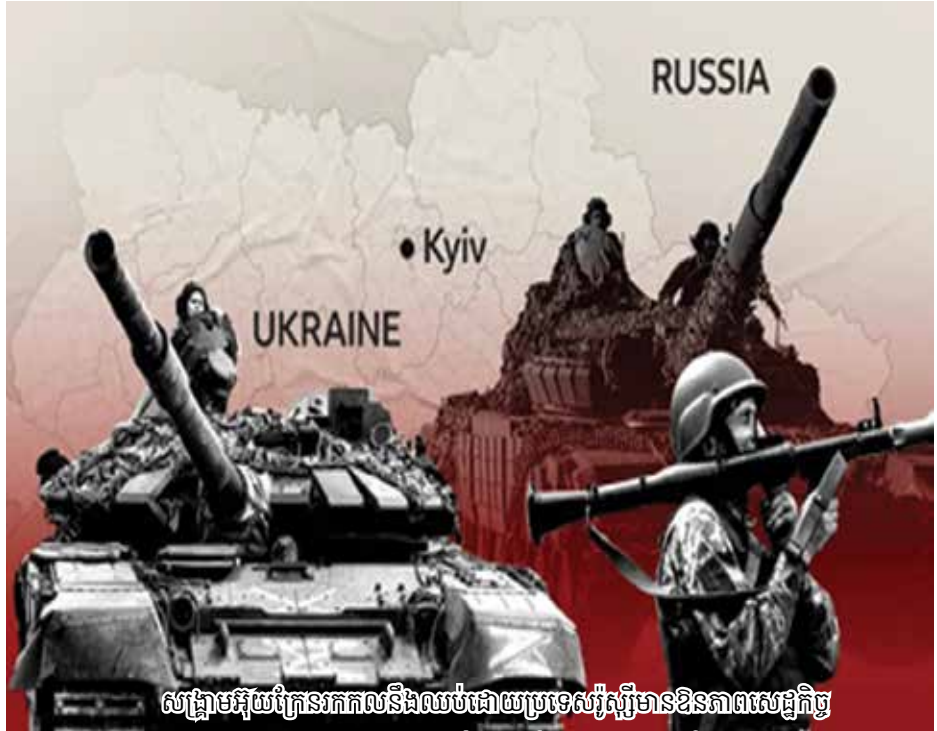
សង្គ្រាមអ៊ូក្រែនរកកលនិងឈប់ដោយប្រទេសរុស្ស៊ីមានឱនភាពសេដ្ឋកិច្ច

អ្នកសង្កេតការយល់ថា ទាំងរុស្ស៊ី និង ទាំងអ៊ូក្រែន ពុំអាចបន្តសង្គ្រាមបានយូរទេ ដោយ ១ រុស្ស៊ីមានឱនភាពថវិការដ្ឋាន និងគ្មានទាហានជំនាញ សម្រាប់វាយលុកគ្រប់គ្រាន់ផង, រីឯទី ២ ខាងអ៊ូក្រែនវិញ ក៏សង្ឃឹមតែទៅលើអាមេរិកាំង និងអឺរ៉ុបទាំងស្រុងដែរ ដូច្នោះអ្នកទាំង២ ត្រូវរកប្រកបញ្ចប់សង្គ្រាម ដោយមិនឲ្យបាក់មុខតែរៀងៗខ្លួន។