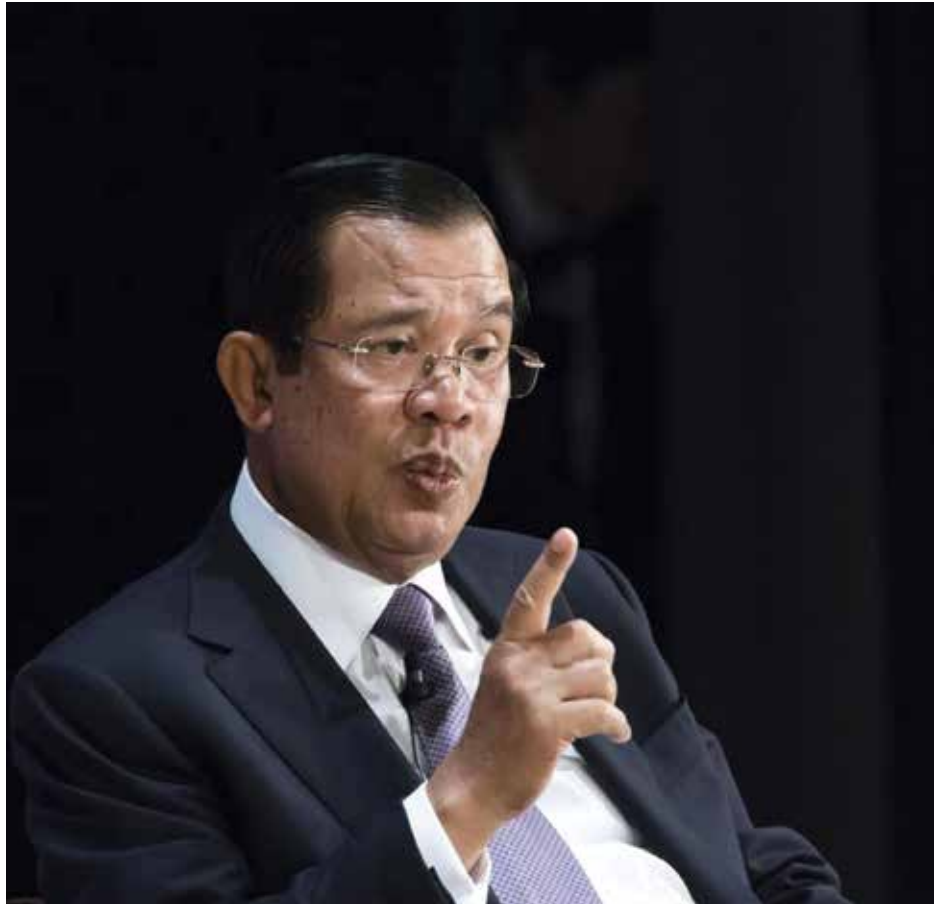
សម្តេចតេជោ ហ៊ុន សែន

ក្រៅពីនេះ រដ្ឋាភិបាលបក្សកាន់អំណាចក៏បានចាប់ខ្លួនមេដឹកនាំបក្សប្រឆាំង លោក កឹម សុខា ទាំងមានអភ័យឯកសិទ្ធិជាសមាជិករដ្ឋសភា និងដាក់