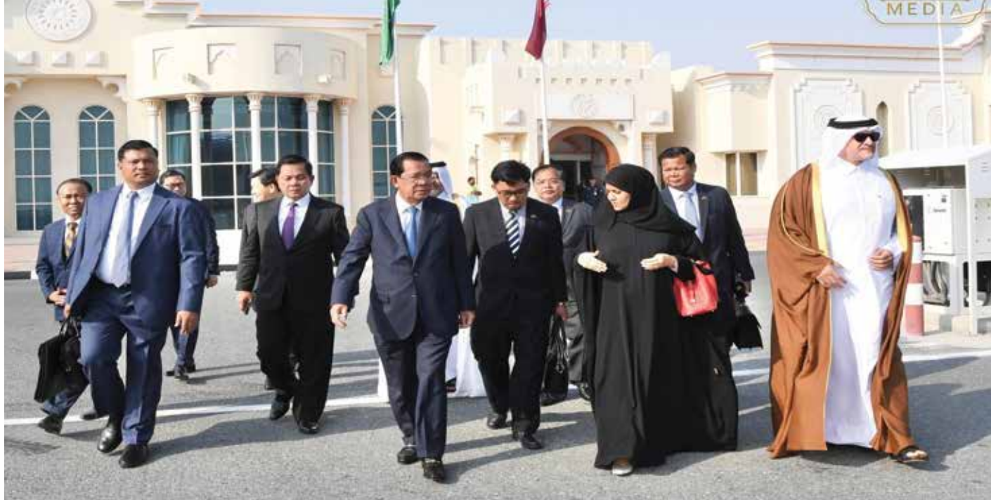
សម្តេច ហ៊ុន សែន ធ្វើដំណើរទៅទស្សនៈកិច្ចនៅប្រទេសអារ៉ាប់រួម

ប្រកាសចុះចូលជាមួយគណបក្សប្រជាជនកម្ពុជា តាំងពីចុងខែមេសា ឆ្នាំ២០២៣ មកម៉្លេះ។