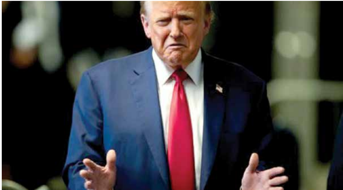
ប្រធានាធិបតីជាប់ឆ្នោត២០២៤ ខណ្ឌល ត្រាំ

ពី«តុលាការក្រុងនូវយ៉ក» ពីបទក្លែងបន្លំ ឯកសារពន្ធដារចំនួន៣៤ករណី ។ ដោយសារតែការជាប់ឆ្នោតជាប្រធានាធិបតី លោក ត្រាំ អាចរកបាននូវមេធាវីខ្លាំងៗ