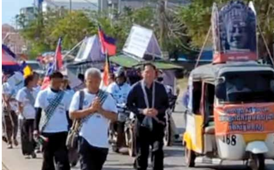
បាតុកម្មរបស់សកម្មជនសង្គមស៊ីវិលនៅភ្នំពេញ

ការគោរពសិទ្ធិមនុស្ស ដោយការដោះស្រាយបញ្ហាសំខាន់ៗអំពីសិទ្ធិមនុស្ស ដូចជា ដោះលែងសកម្មជនសិទ្ធិមនុស្សដែលកំពុង