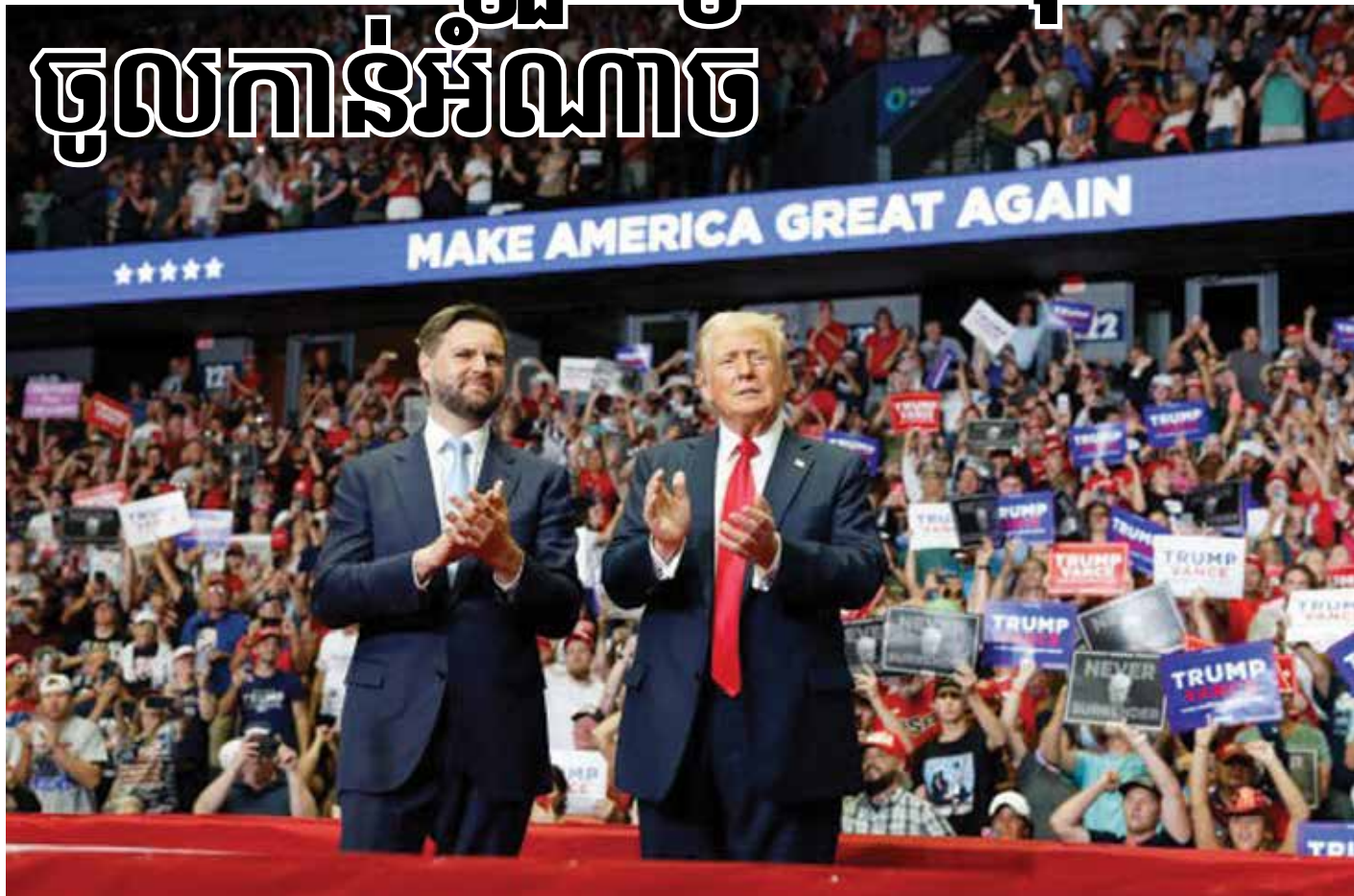
JD Vane vice President Elect & Donald Trump President elect of USA

អីរ៉ុប ថ្ងៃទី៥ ធ្នូ ២០២៤ នៅជាង៥០ថ្ងៃមុនប្រធានាធិបតីថ្មី ឧណាល ត្រាំ ចូលកាន់អំណាច មានការ ជ្រើសរើសរជនប្រតិបត្តិ មកកាន់មុខ ដំណែងជាអគ្គនាយកដ្ឋាន ដើម្បីអនុវត្តន៍ នយោបាយ«ម៉ាត្លា MAGA Make American Great Again»សម្រាប់អាណត្តិ ថ្មីឆ្នាំ២០២៥ នោះ។ នៅអាណត្តិលោក ត្រាំ ថ្មីនោះ ក៏ពុំមានលក្ខណៈដូចពីអាណត្តិ មុនទេ អ្វីដែលគេដឹង តាមសេចក្តី ថ្លែងការណ៍ ក្តីបារម្ភគួរឲ្យខ្លាចទៅវិញ។ ទោសលោកត្រាំប្រមាណ៨០ករណី បានត្រូវលើកលែងដោយតុលាការ ជាន់ខ្ពស់សម្រេចថាគ្មានទោសដោយសារ កំហុសកើតនៅក្នុងការកិច្ចរបស់ឧណាល