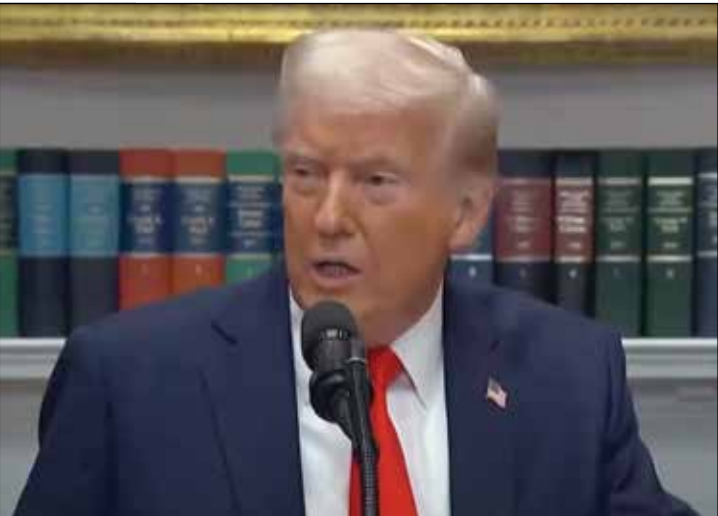
ប្រធានាធិបតីអាមេរិក ដូណាល់ ត្រាំ

ប្រទេសផ្សេងទៀតឬផ្លាស់ទីផលិតកម្ម ទៅសហរដ្ឋអាមេរិក ការផ្លាស់ប្តូរ ទាំងនោះអាចចំណាយពេលច្រើន ឆ្នាំ។