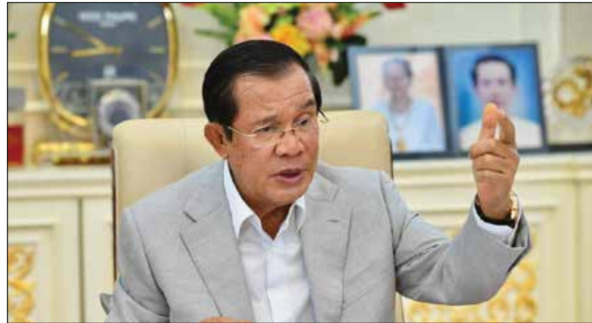
សម្តេច ហ៊ុន សែន ទៅទស្សនៈកិច្ចនៅវៀតណាម

ថា ច្បាប់នេះអាចនឹងត្រូវប្រធានព្រឹទ្ធសភា លោក ហ៊ុន សែន ចុះហត្ថតទៅទំព័រទី០៩