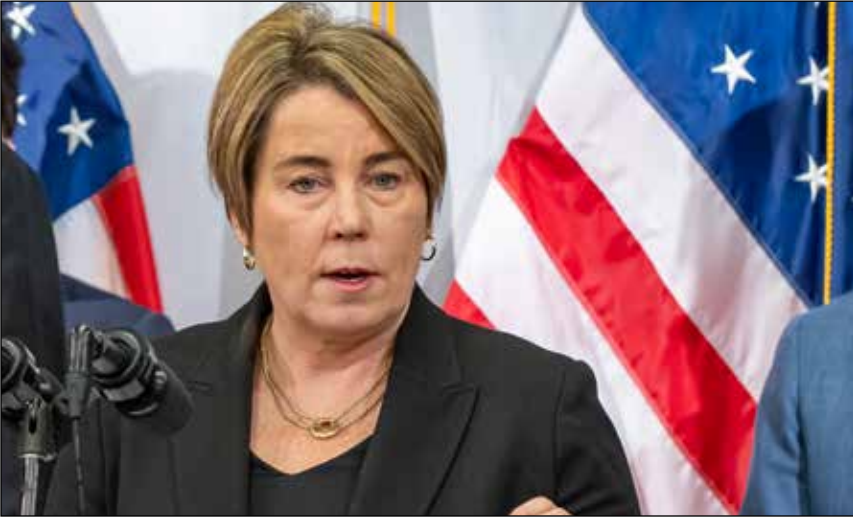
Governor Maura Healey

Tariffs on Canada are expected to impact the dairy industry and raise the cost of milk, cheese and butter. Canada is also one of the largest suppliers of softwood lumber in the