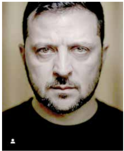
លោកប្រធានាធិបតីប្រទេស អ៊ុយក្រែន ស៊ីលេនស្គី

1) Zelensky showed up in military fatigues as he has done at