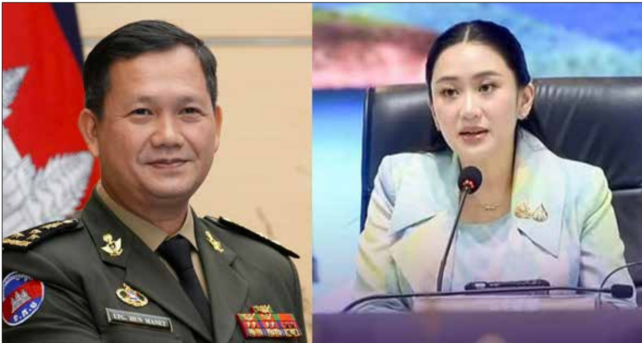
លោក ហ៊ុន ម៉ាណែត នាយករដ្ឋមន្ត្រីកម្ពុជា