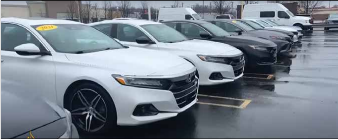
ឡានតម្កល់សំរាប់លក់នៅប្រទេសអាមេរិក

បានអនុញ្ញាតឱ្យផលិតផលផ្លាស់ប្តូរ រវាងប្រទេសទាំងបីដោយមិនគិតពន្ធ ស្រដៀងទៅនឹងរបៀបដែលពួកគេ មានជាច្រើនទសវត្សរ៍ក្រោមកិច្ច ព្រមព្រៀងពាណិជ្ជកម្មសេរីអាមេរិក ខាងជើង ឬ NAFTA ពីមុន។ នៅ ក្រោមលក្ខខណ្ឌនៃកិច្ចព្រមព្រៀង កិច្ចព្រមព្រៀងនេះមិនត្រូវបានគេ សន្មត់ថានឹងមានការចរចាឡើងវិញ រហូតដល់ខែកក្កដា ឆ្នាំ ២០២៦ ប៉ុន្តែ ការផ្លាស់ប្តូររបស់លោក ត្រាំ ក្នុងការ