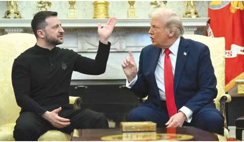
លោក ត្រាំ និងលោក វ៉ាន ផ្ទះការិយាល័យប្រកែកគ្នាប្រាប់គ្នាប្រាប់គ្នាជាមួយលោក ហ្សេលេនស្គី នៅក្នុងការិយាល័យរាងពងក្រពើរបស់ប្រធានាធិបតីអាមេរិក

លោក ហ្សេលេនស្គី បានសួរថាតើលោក វ៉ាន បានទៅអ៊ុយក្រែនឬអត់ទេ? លោក វ៉ាន បាននិយាយថាគាត់មិនធ្លាប់ទេ បានមើលតាមវីដេអូ។ លោក វ៉ាន បានចោទប្រកាន់លោក ហ្សេលេនស្គី ថាមានបញ្ហានាំបុរសចូលក្នុងផ្ទះយោធា លោក ហ្សេលេនស្គី បានព្យាយាមនិយាយ ប៉ុន្តែត្រូវបានរំខានដោយ លោក ត្រាំ ដែលបាននិយាយទាំងកំហឹងយ៉ាងខ្លាំង។