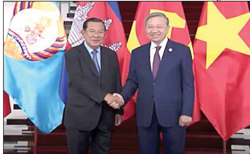
លោក ហ៊ុន សែន ទៅជួបមេដឹកនាំរៀតណាមនៅហាណូយ

ការអះអាងនេះ ធ្វើឡើងបន្ទាប់ពីមេដឹកនាំកំពូលប្រទេសកម្ពុជាបានជួបជាមួយមេដឹកនាំរៀតណាម និងឡាវ កាលពីពេលថ្មីៗនេះ។