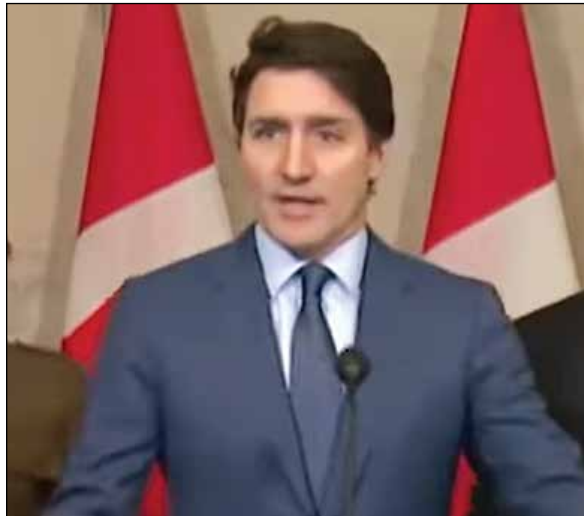
Canada Prime Minister Justin Trudeau

ទាំងអស់ពីប្រទេសចិនបន្ថែមលើពន្ធ ១០% ដែលមានស្រាប់ដែលគាត់បាន ដាក់លើទំនិញរបស់ចិនកាលពីខែមុន រួមមានផលិតផលដូចជាអេឡិចត្រូនិក ស្បែកជើង ឱសថ និងគ្រឿងសំអាង។ ពន្ធទាំងនោះ គឺបន្ថែមលើពន្ធដែល