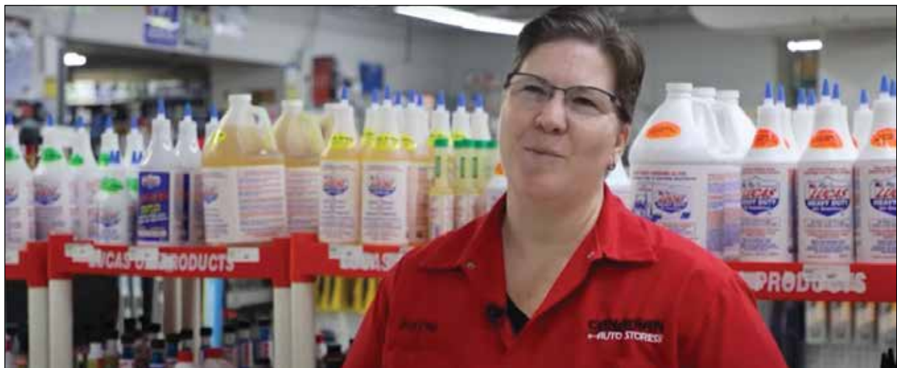
អ្នកលក់ទំនិញនៅអាមេរិកាំងខ្វល់ខ្វាយរៀងពន្ធឡើងថ្លៃ

សេដ្ឋវិទូនៅទូទាំងវិសាលគមនយោបាយបានព្រមានថា ពន្ធគយដែលត្រូវបានបង់ដោយក្រុមហ៊ុនអាមេរិកដែលនាំចូលទំនិញនឹងបង្កើនអ្វីដែលអ្នកប្រើប្រាស់បង់សម្រាប់ទំនិញជាច្រើនប្រភេទរួមទាំងយានយន្ត គ្រឿងអេឡិចត្រូនិកផលិតផលផងដែរ។