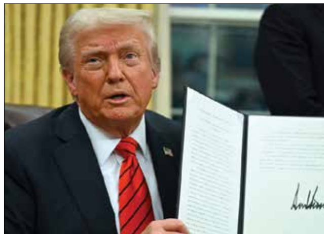
ប្រធានាធិបតីសហរដ្ឋអាមេរិក ឧណាល ត្រម

នៅក្នុងការសម្រេចចិត្តរបស់គាត់ថា "ជាដំបូងភក្តីភាពនៅសហរដ្ឋអាមេរិក កើតចេញពីការពិតនៃកំណើត"។ "វា មិនអាស្រ័យលើស្ថានភាពឪពុកម្តាយ របស់កុមារ ហើយក៏មិនត្រូវផ្តាច់មុខ ដូចដែលចុងចោទបានចោទប្រកាន់ ដែរ។ ការអនុវត្តទស្សនៈរបស់ចុងចោទ ចំពោះភក្តីភាពនឹងមានន័យថា កូន របស់ពលរដ្ឋមានសញ្ជាតិ និងអ្នកមាន លំនៅឋានស្របច្បាប់នឹងមិនមែនជា ពលរដ្ឋមានសិទ្ធិពីកំណើតទេ ជា លទ្ធផលសូម្បីចុងចោទក៏មិនគាំទ្រ ដែរ។"