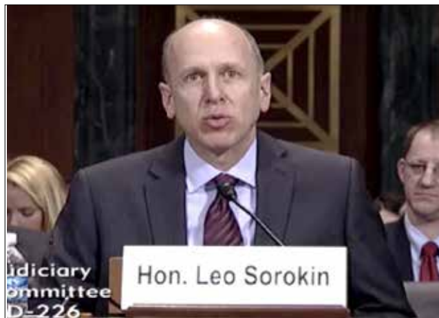
Judge Leo Sorokin of the U.S. District Court for the District of Massachusetts.