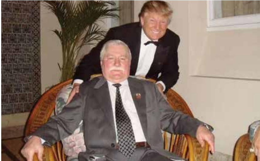
ឧណាល ក្រុម រូបថតមុនកាន់តំណែងប្រធានាធិបតី និងលោក FaPSA ប្រធានាធិបតី ប៉ូឡូញ

គុណការកុម្មុយនិស្ត។ ព្រះរាជអាជ្ញានិងចៅក្រម ដែលដើរតួក្នុងនាមប៉ូលីសនយោបាយកុម្មុយនិស្តដែលមានអំណាចទាំងអស់ នឹងពន្យល់យើងថា ពួកគេកាន់អំណាចទាំងអស់ខណៈពេលដែលយើងមិនមាន។