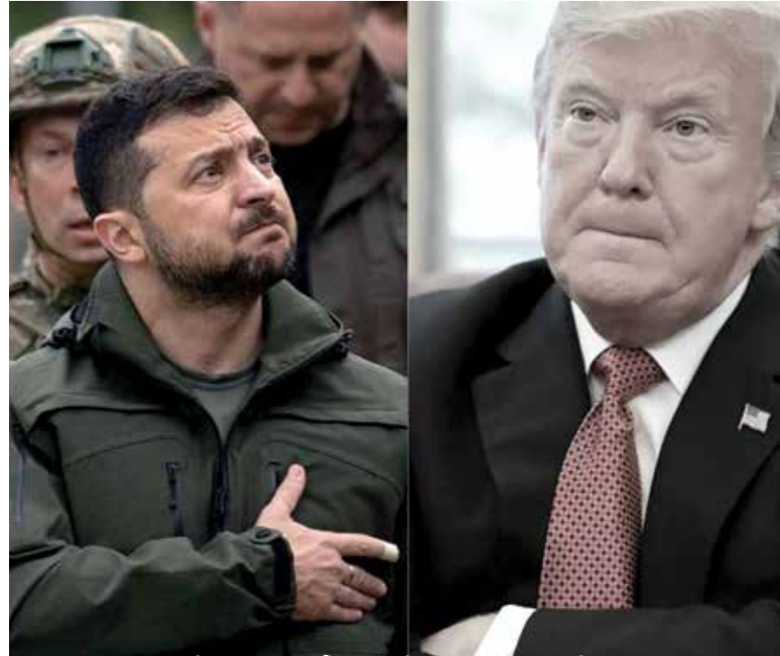
ប្រធានាធិបតីអ៊ុយក្រែន សីលែនស្គី និងប្រធានាធិបតី ឧណាល ត្រាម

- ប្រធានាធិបតីប្រទេសម៉ូលដាវីលោកស្រីMaia Sanduមានប្រសាសន៍ថា៖ "ការពិតគឺសាមញ្ញ។ រុស្ស៊ីល្អានពានអ៊ុយក្រែន។ រុស្ស៊ីជាអ្នកល្អានពាន។ អ៊ុយក្រែនការពារសេរីភាពរបស់ខ្លួន