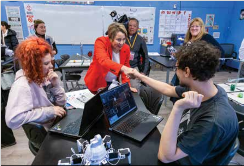
ប្រមុខរដ្ឋ ម៉ារី ហ្វេលី

MyCAP គឺជាផ្នែកមួយដ៏សំខាន់ នៃការងាររបស់រដ្ឋបាលដើម្បីភ្ជាប់ ទំនាក់ទំនងនិស្សិតរដ្ឋម៉ាសាឈូសេត ឲ្យបានកាន់តែច្រើន ជាពិសេសអ្នក ដែលមិនសូវមានតំណាងក្នុងការអប់រំ កម្រិតឧត្តមសិក្សា មានការគាំទ្រ