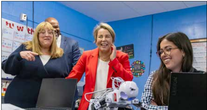
ប្រមុខរដ្ឋ ម៉ារី ហៀលី